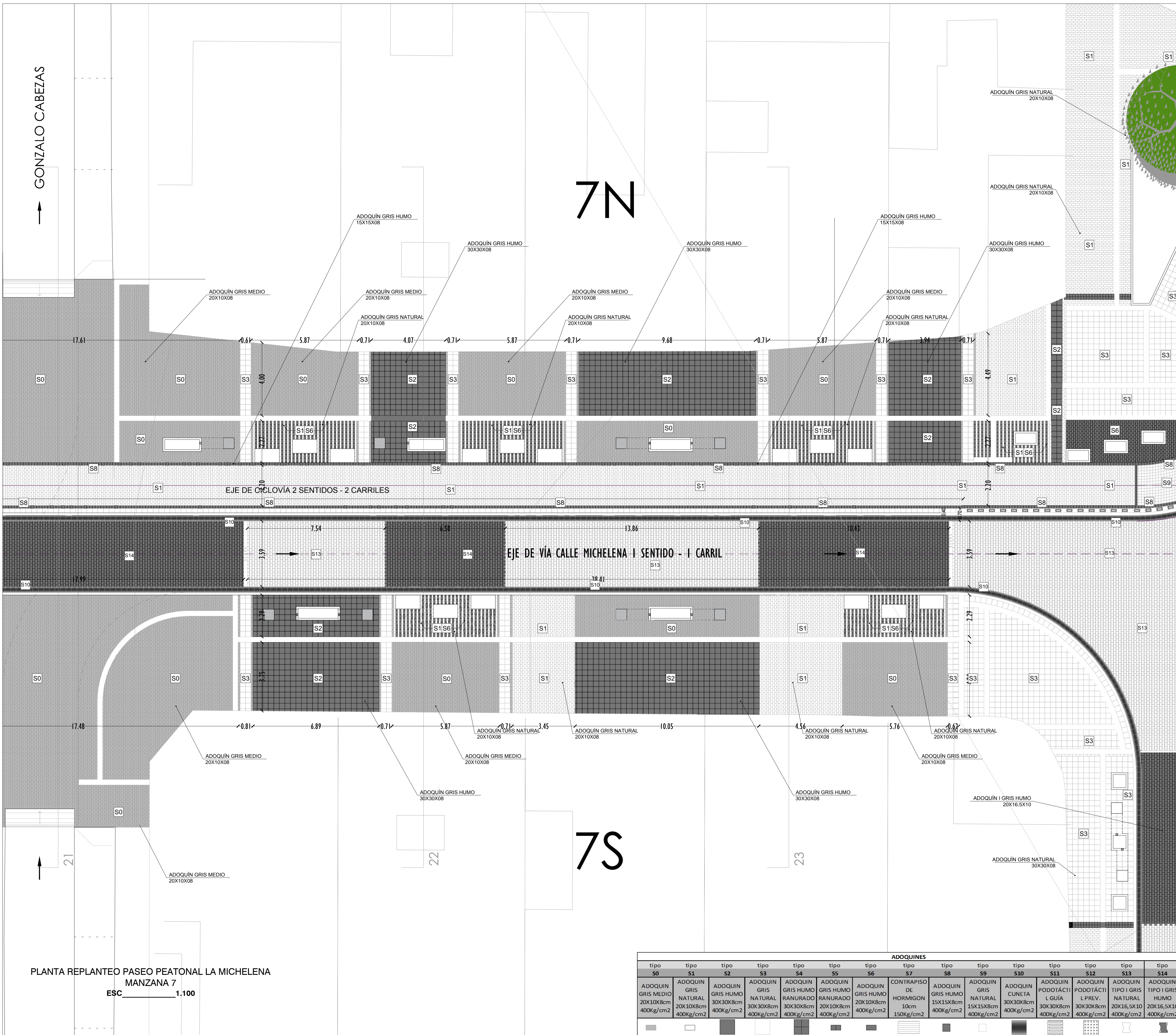
PLANTA REPLANTEO PASEO PEATONAL LA MICHELINA MANZANA 7 ESC 1:100