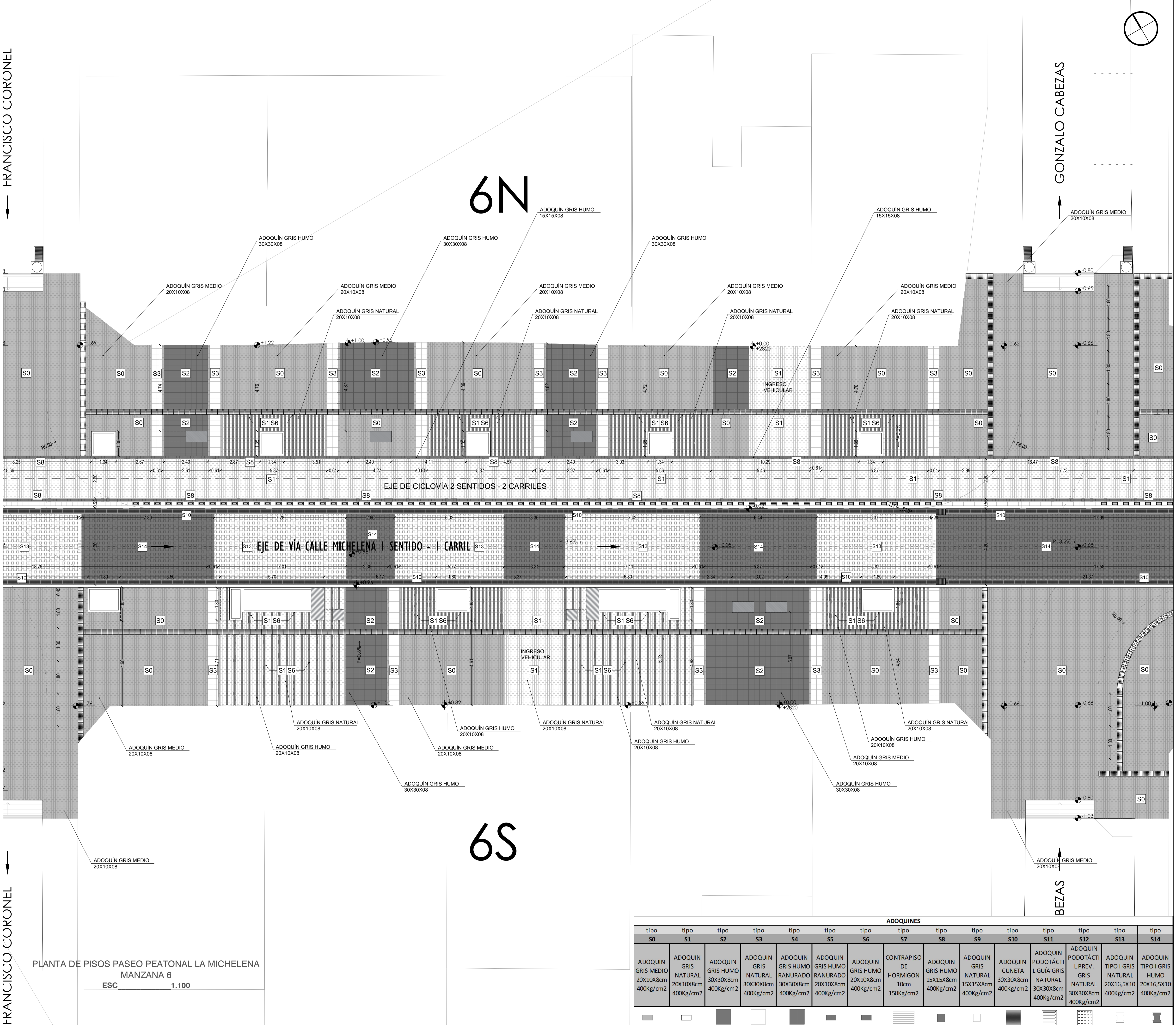
PLANTA DE PISOS PASEO PEATONAL LA MICHELINA MANZANA 6 ESC. 1.100