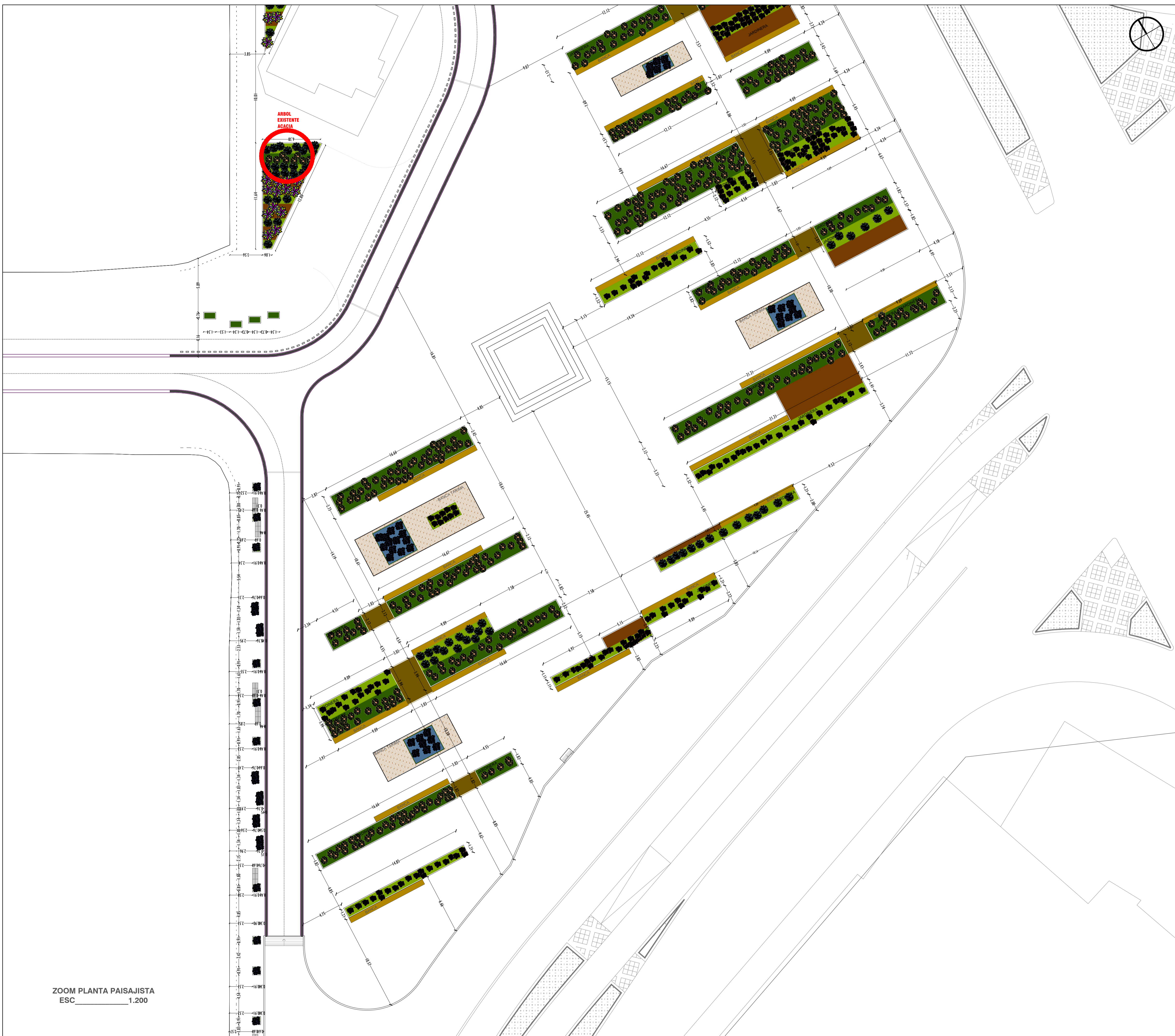
ZOOM PLANTA PAISAJISTA ESC 1:200