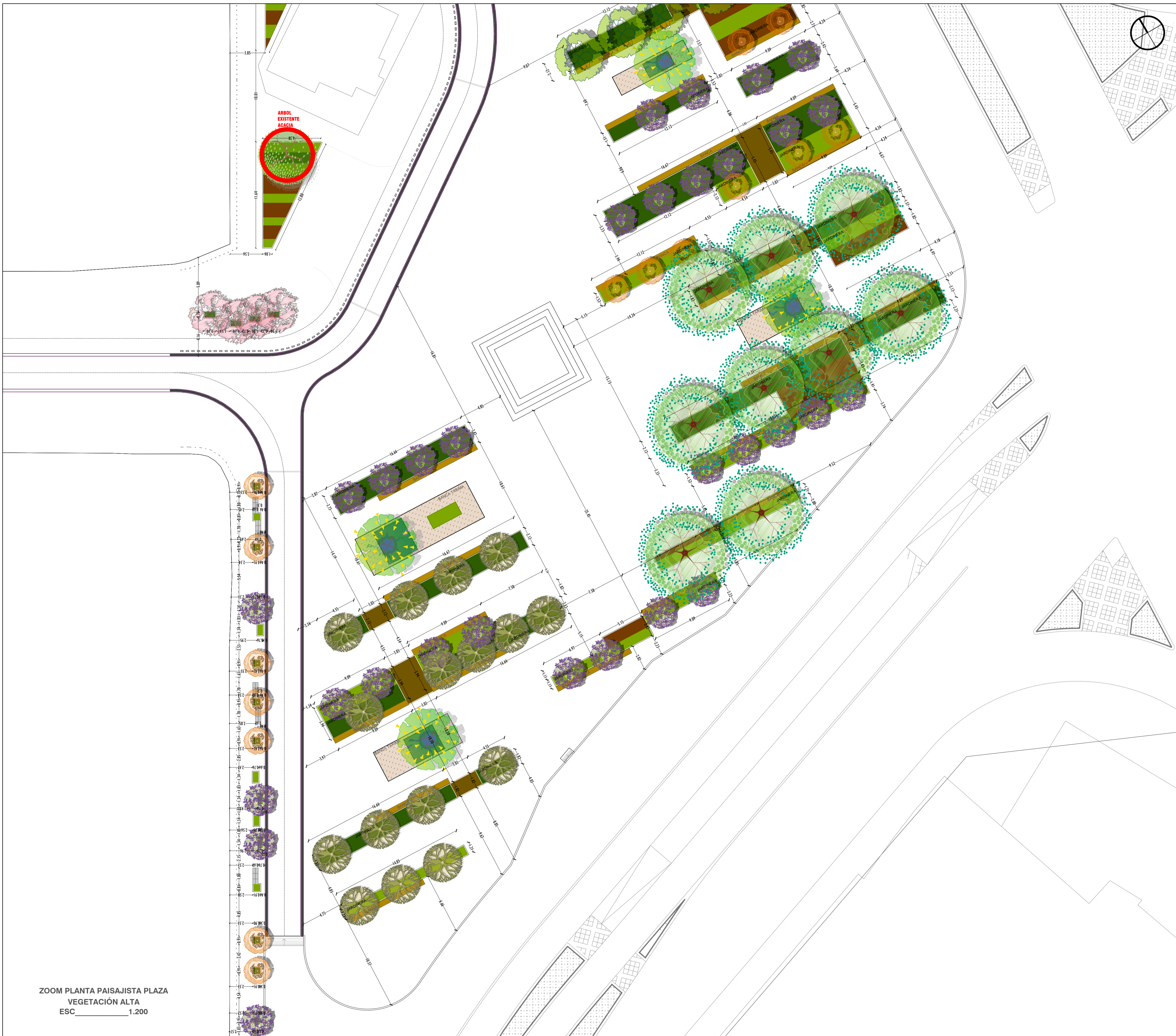
ZOOM PLANTA PAISAJISTA PLAZA VEGETACIÓN ALTA ESC 1:200