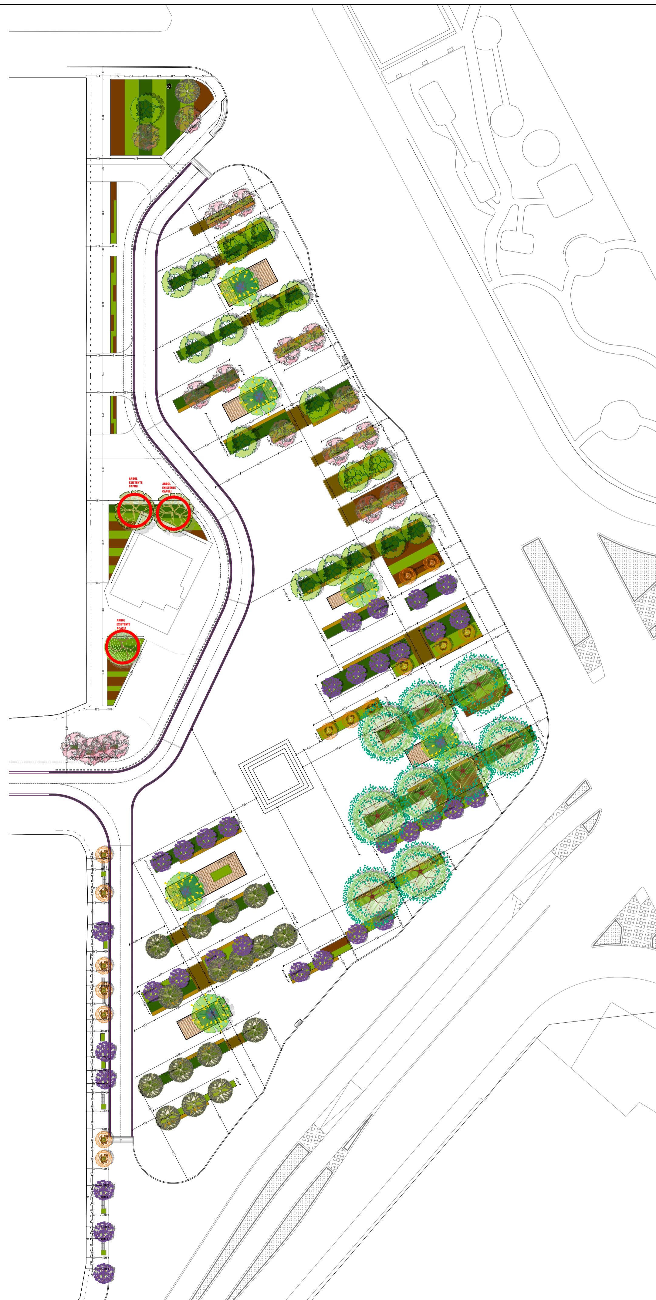
IMPLANTACIÓN PAISAJISTA PLAZA VEGETACIÓN ALTA ESC 1:1.400