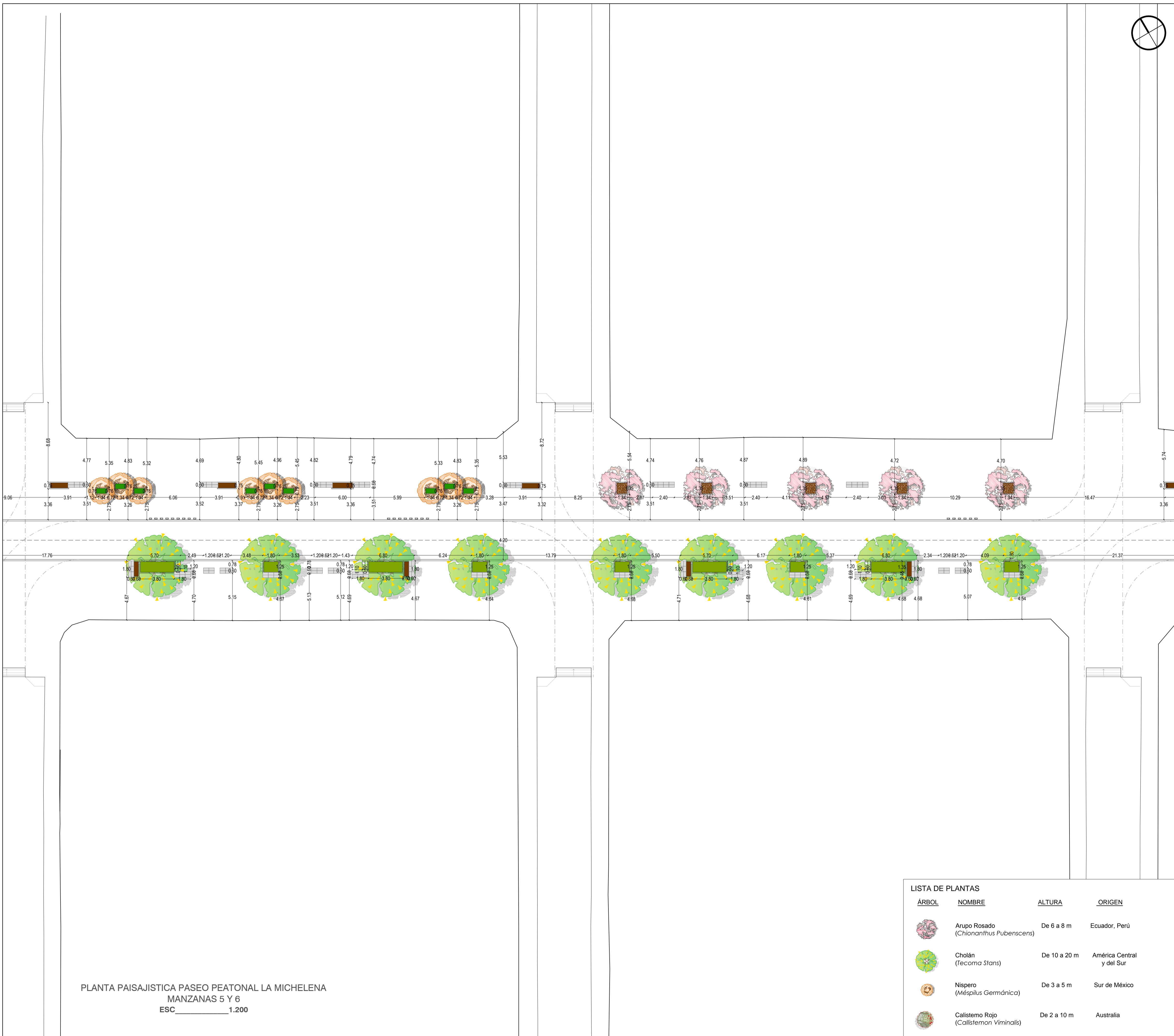
PLANTA PAISAJÍSTICA PASEO PEATONAL LA MICHELENA MANZANAS 5 Y 6 ESC. 1:200