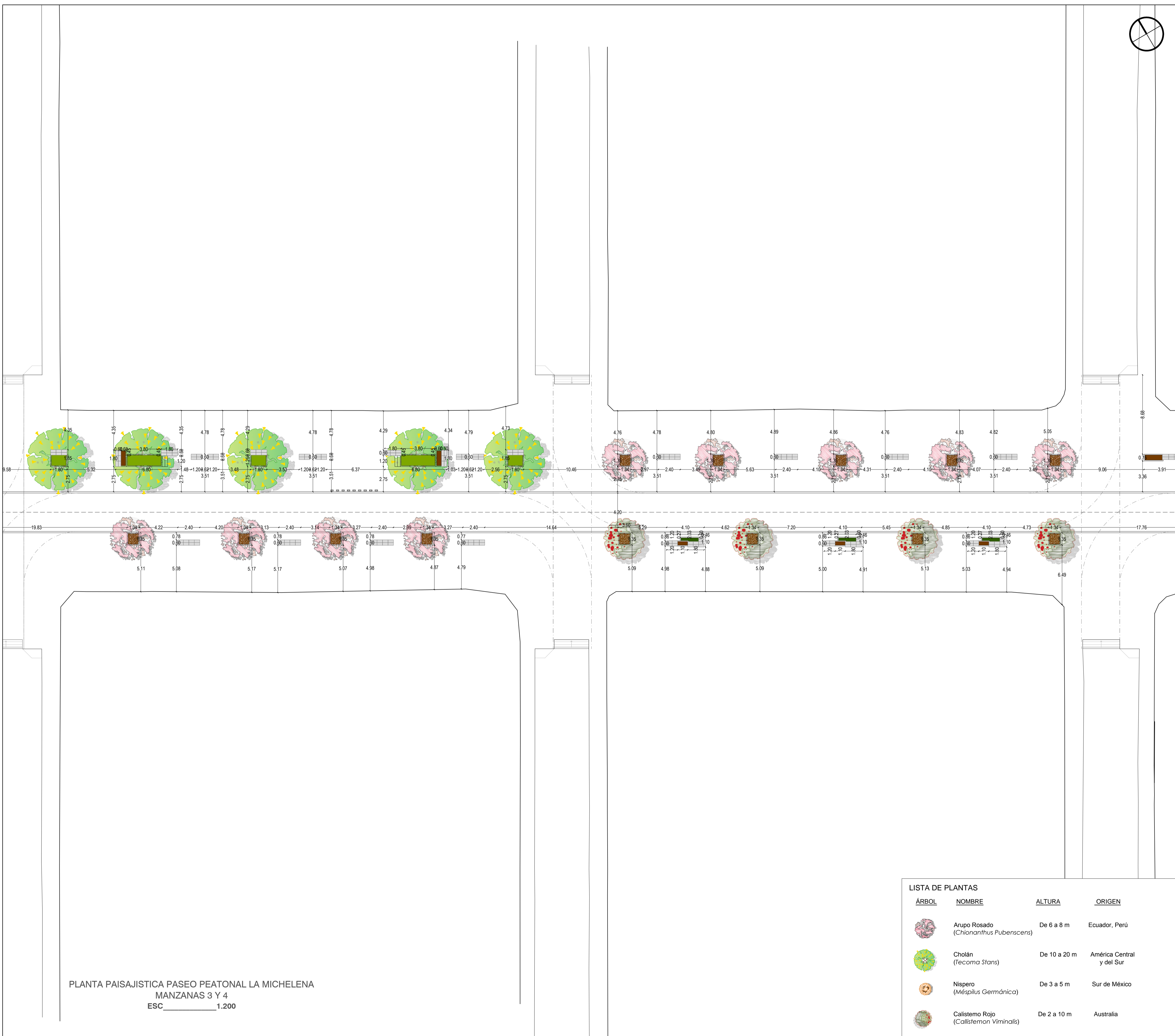
PLANTA PAISAJÍSTICA PASEO PEATONAL LA MICHELENA MANZANAS 3 Y 4 ESC 1:200