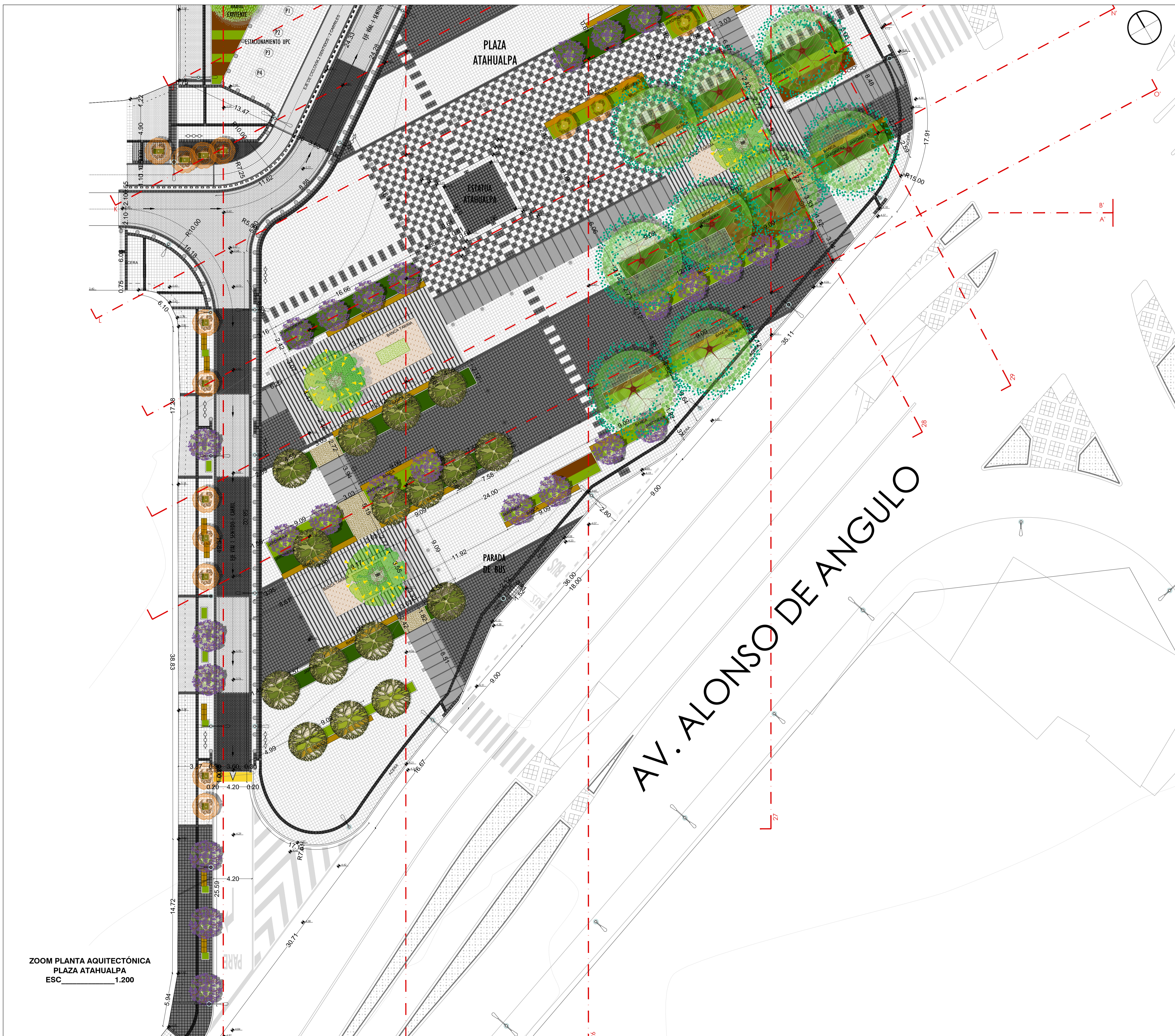
ZOOM PLANTA AQUITECTÓNICA PLAZA ATAHUALPA ESC 1:200