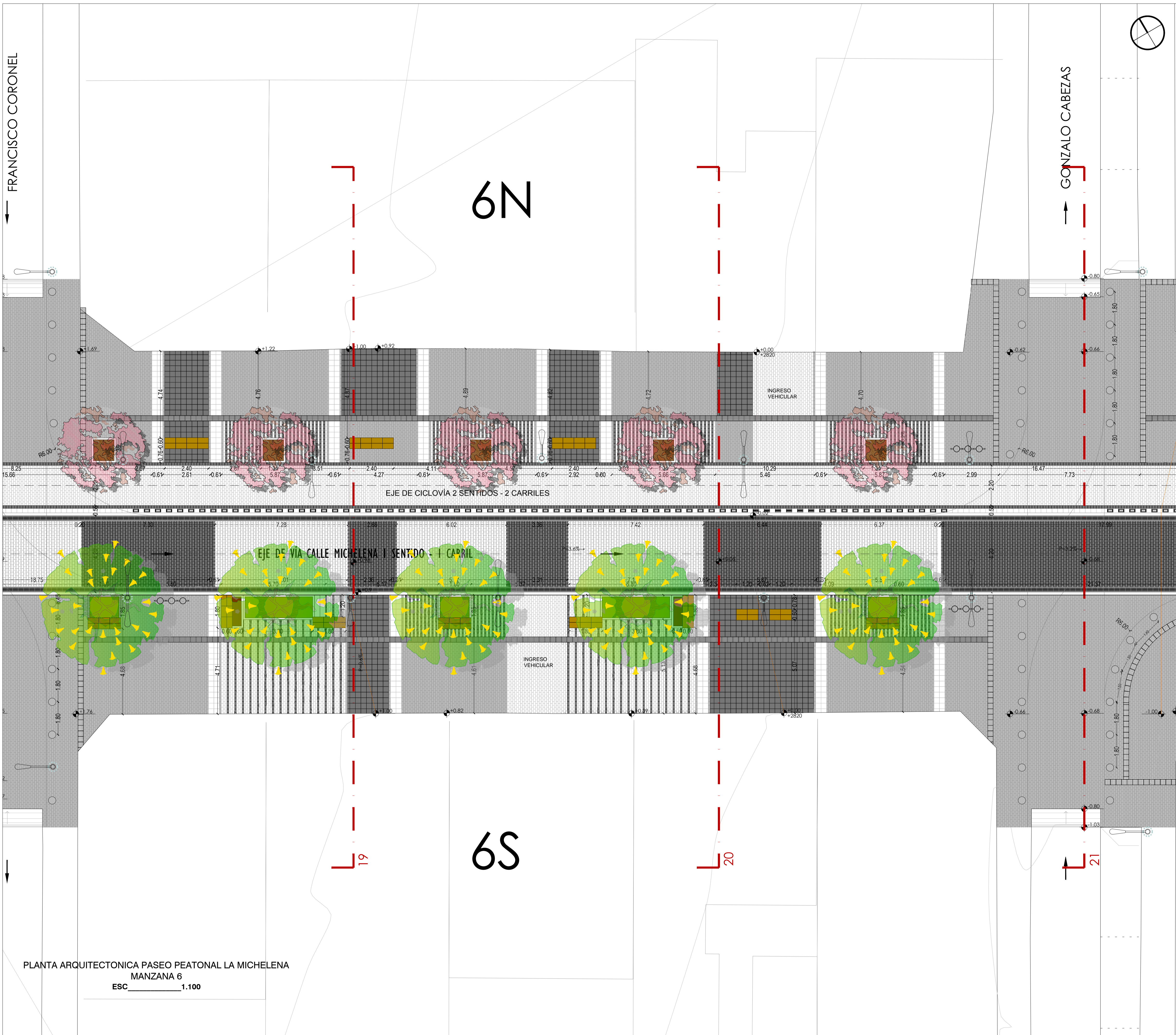
PLANTA ARQUITECTONICA PASEO PEATONAL LA MICHELENA MANZANA 6 ESC 1:100