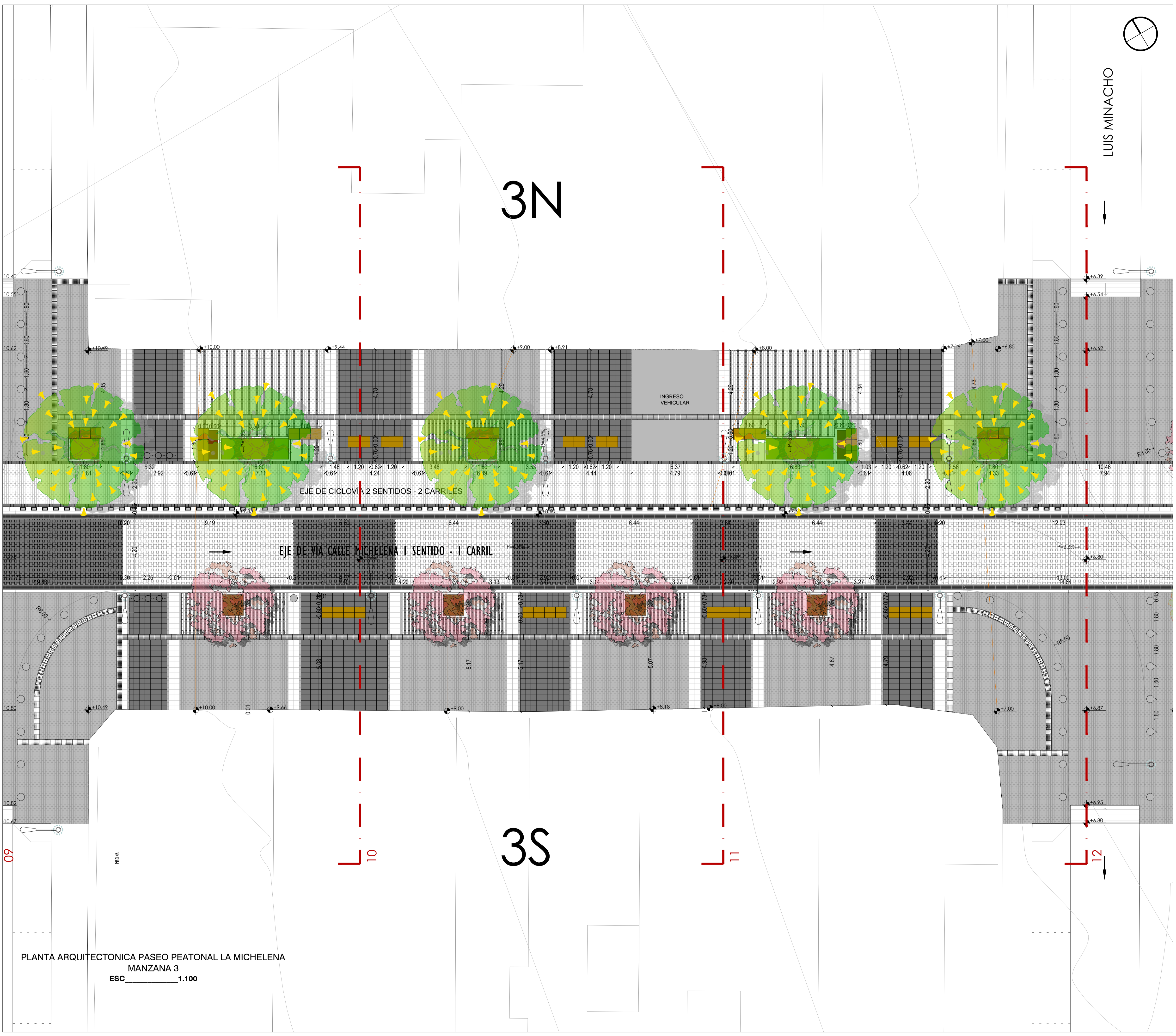
PLANTA ARQUITECTONICA PASEO PEATONAL LA MICHELENA MANZANA 3 ESC 1:100