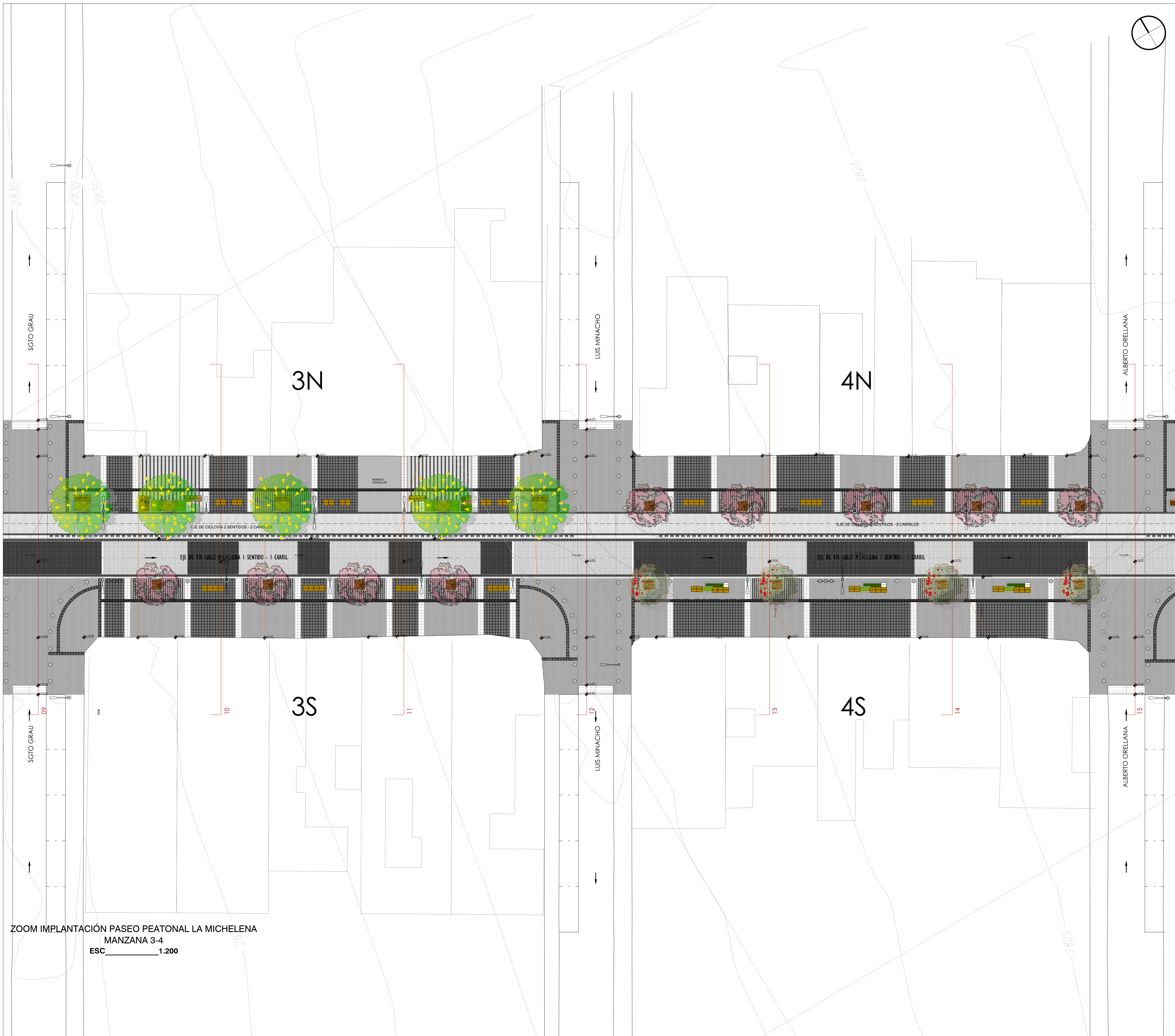
ZOOM IMPLANTACIÓN PASEO PEATONAL LA MICHELENA MANZANA 3-4 ESC 1:200