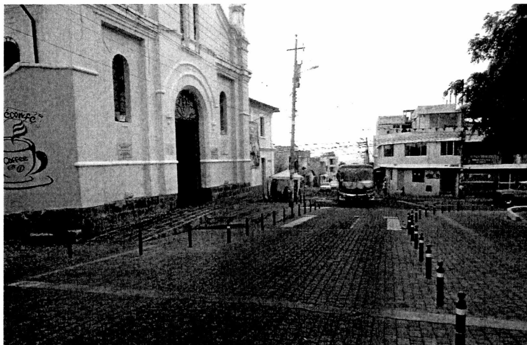
Los alimentadores de la Ecovía circulan por la calle Pablo Calero.