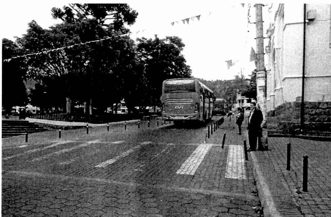
La calzada se encuentra al mismo nivel de las aceras.

Realizado por. Arq. Bruno Barahona Frey Dirección de Proyectos Gerencia de Planificación