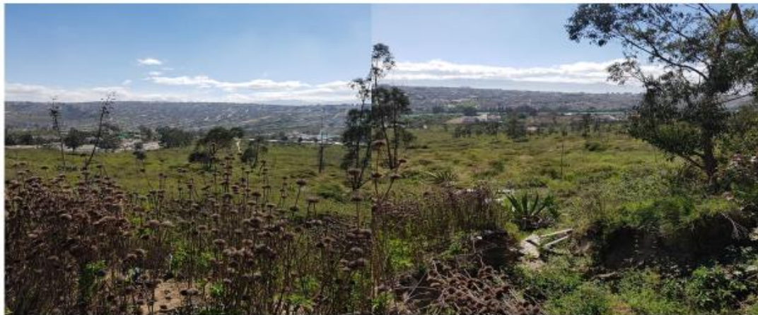
COMISION DE USO DE SUELO