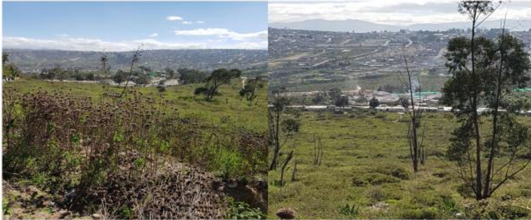
COMISION DE USO DE SUELO