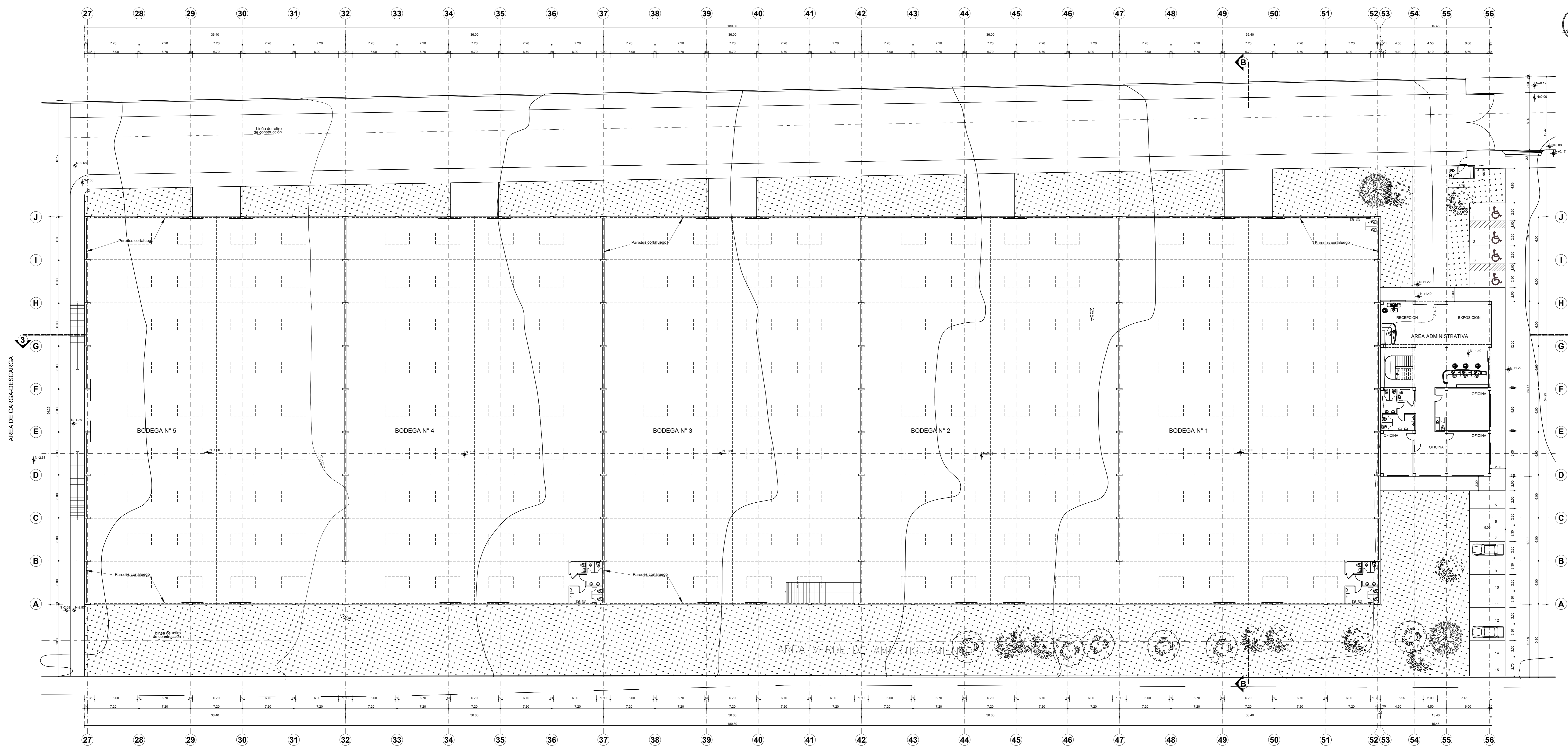
PLANTA BODEGAS N° 1 - N° 5 Y AREA ADMINISTRATIVA ESCALA 1:200