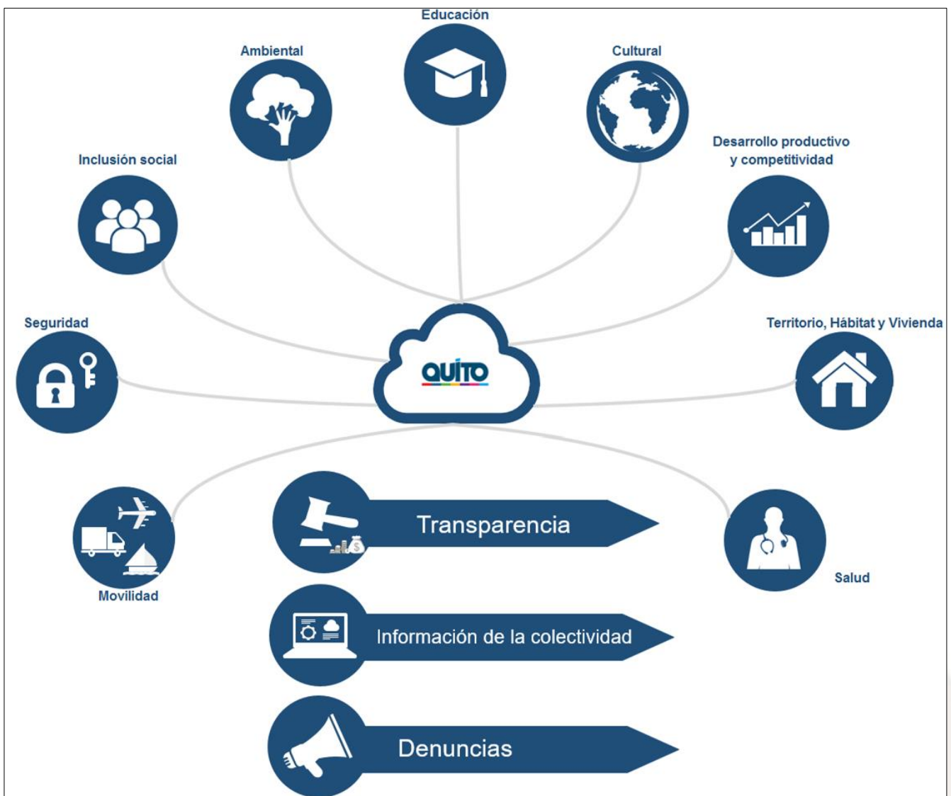
Gráfico No. 2 Ámbitos de Acción

De acuerdo al análisis de normativa legal realizado por MRProcessi, se han definido los ámbitos de acción de la siguiente manera: