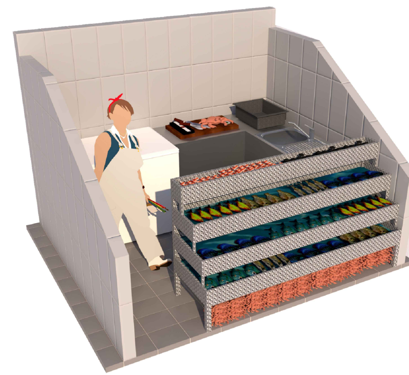
AXONOMETRÍA MÓDULO T6 - MARISCO Y PESCADO S.E