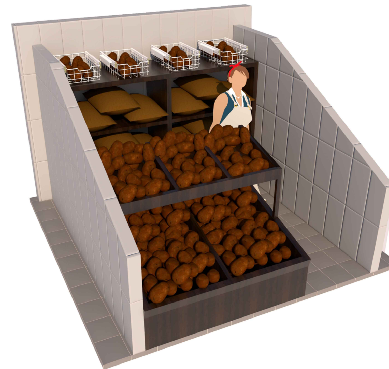
AXONOMETRÍA MÓDULO T1 - PAPAS S.E