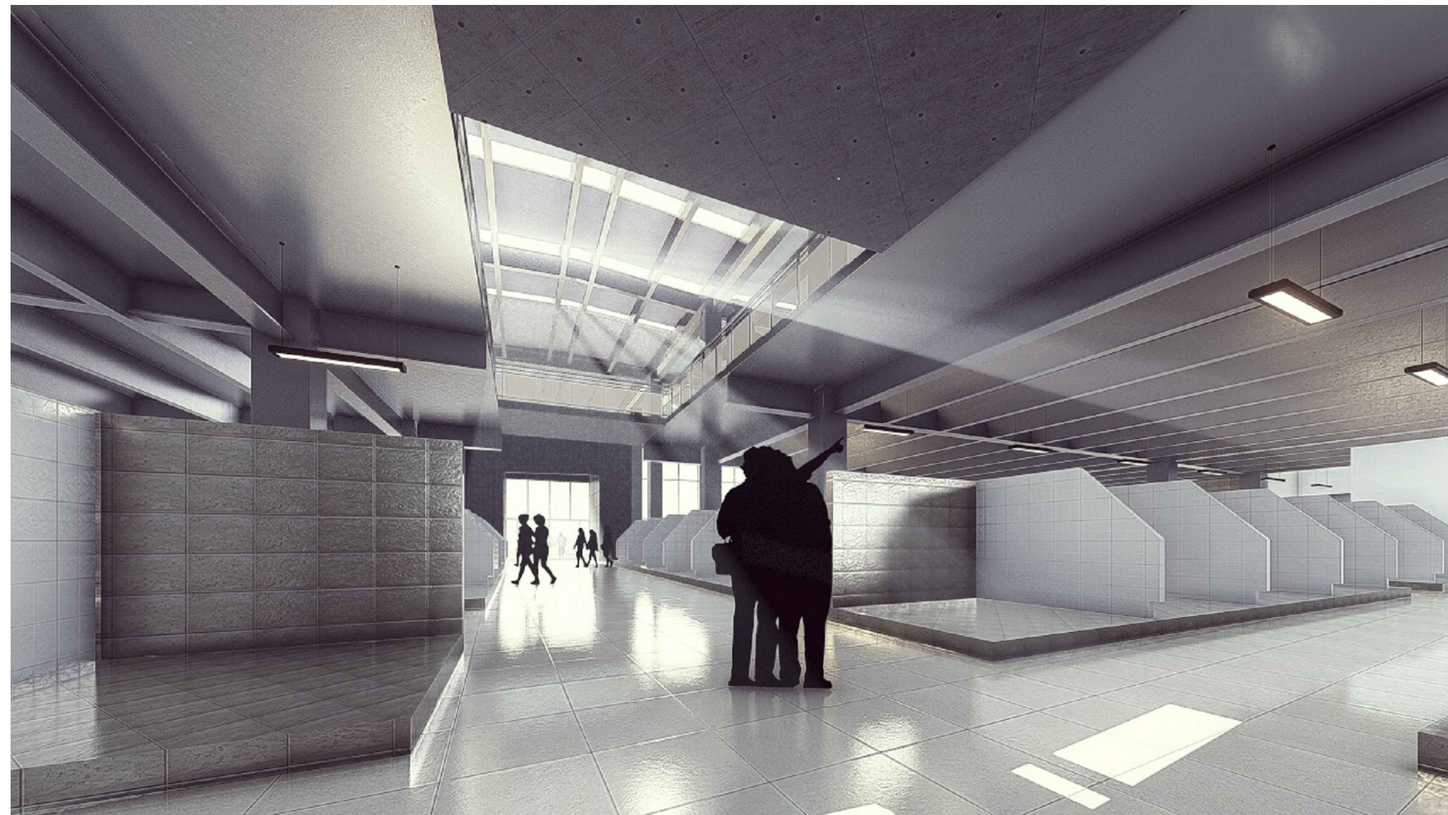
VISTA ILUMINACIÓN CENTRAL