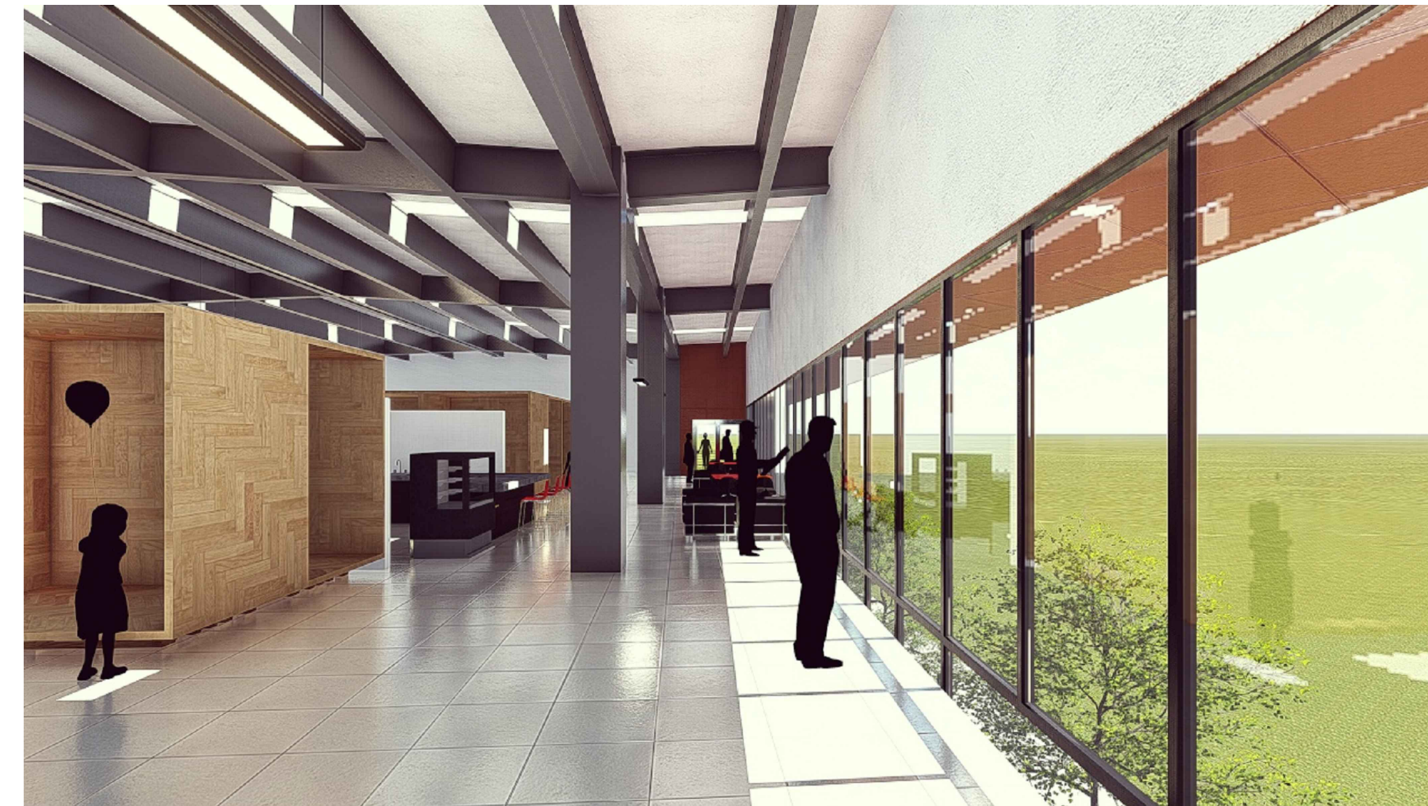
VISTA HACIA BOULEVARD