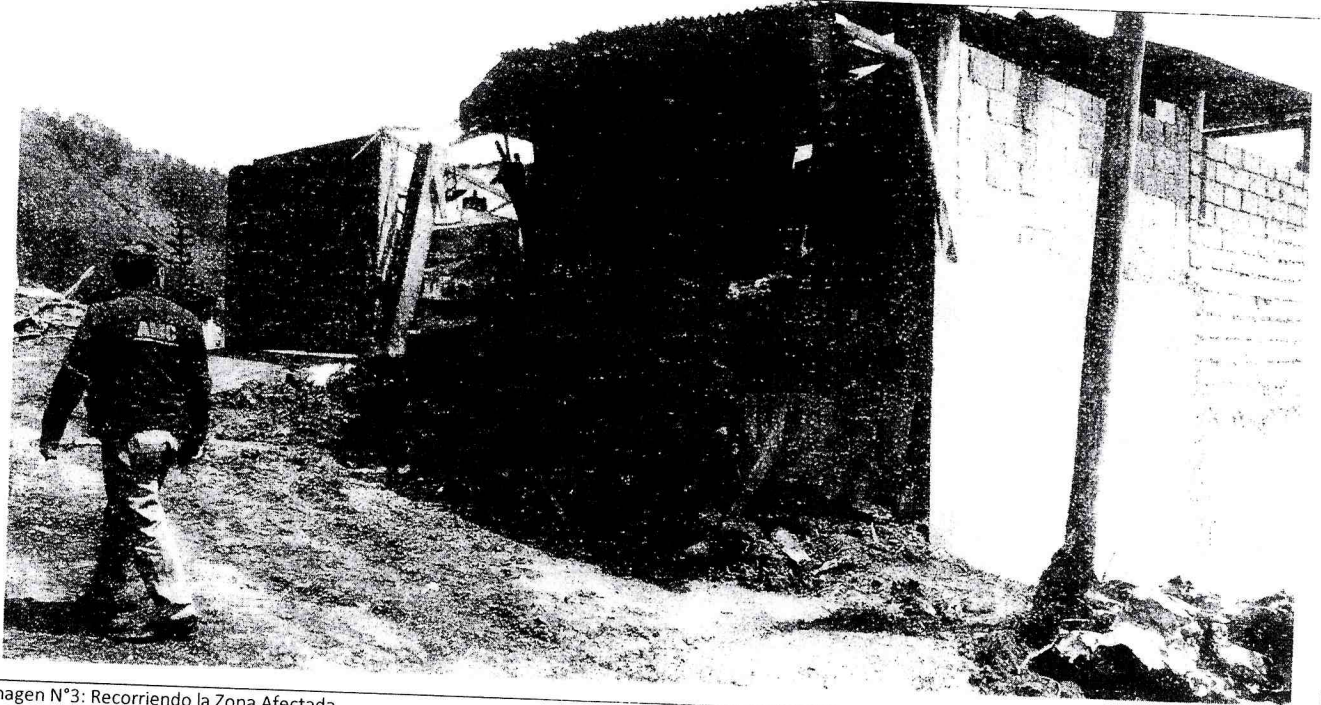
Imagen N°3: Recorriendo la Zona Afectada