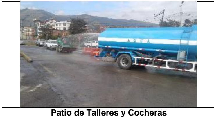
Patio de Talleres y Cocheras