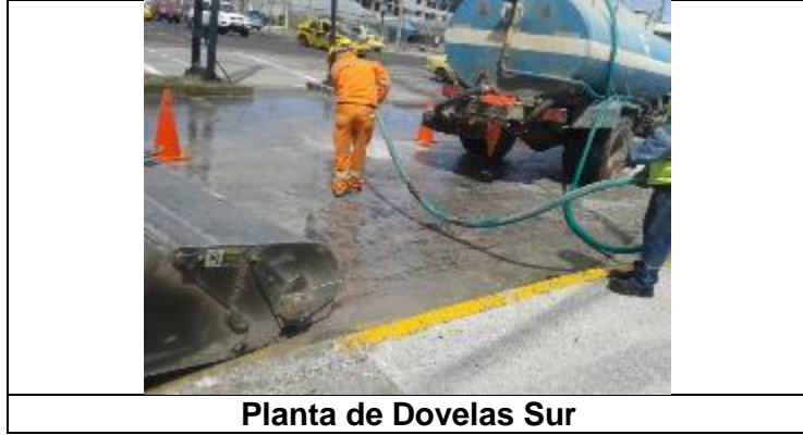
Planta de Dovelas Sur