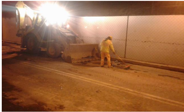
Intercambiador 24 de Mayo