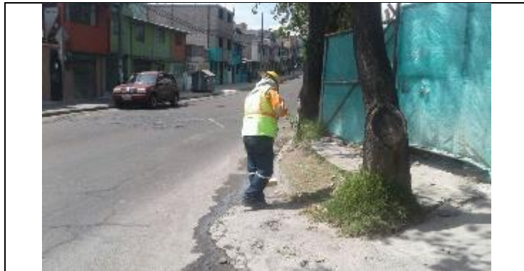
Cardenal de la Torre