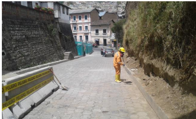
Salida de Emergencia 9