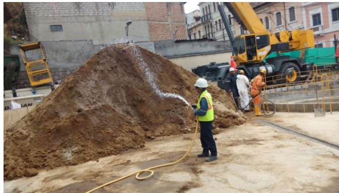
Salida de Emergencia 9