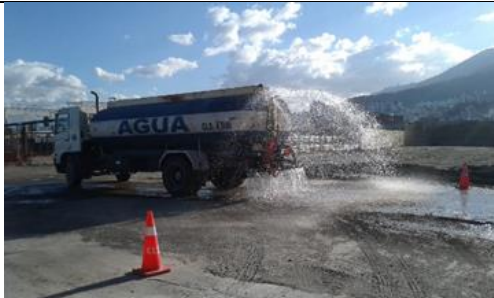
Central Dovelas Norte