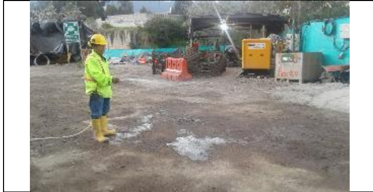
Cardenal de la Torre