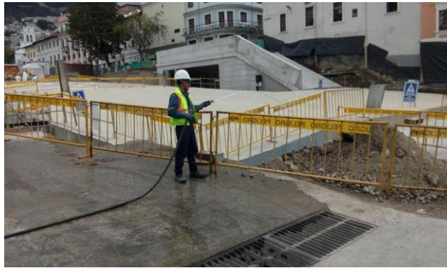
Intercambiador 24 de Mayo