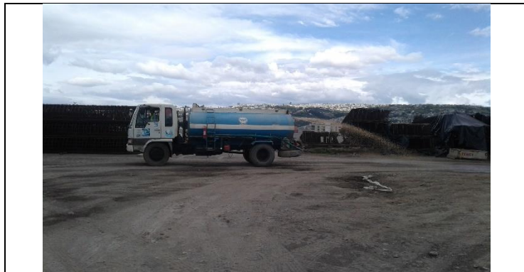
Patio de Talleres y Cocheras