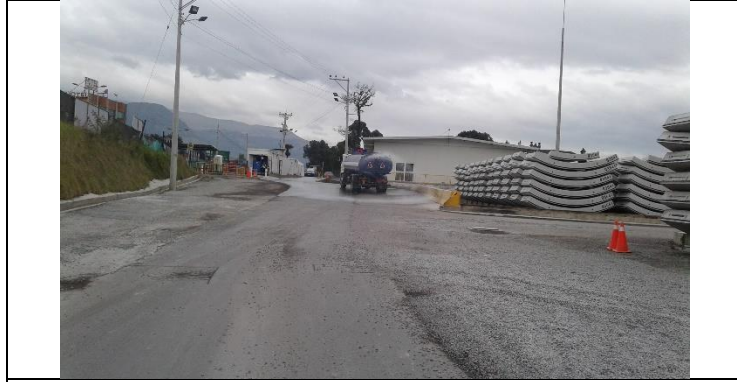
Planta de Dovelas Sur