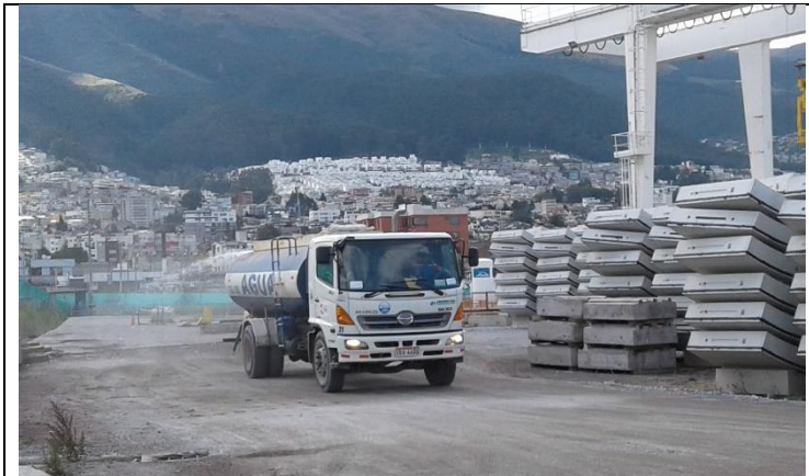
Central Dovelas Norte