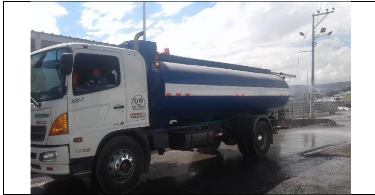
Planta de Dovelas Sur