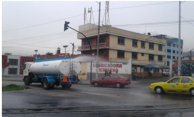
Pozo de Ventilación 5