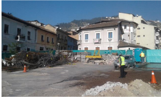
Intercambiador 24 de Mayo