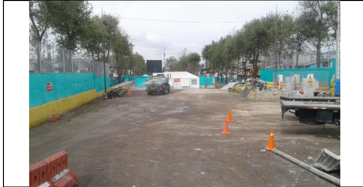
Cardenal de la Torre