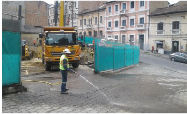
Salida de Emergencia 9