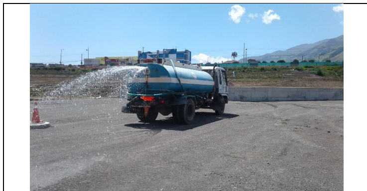
Patio de Talleres y Cocheras