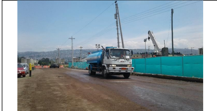
Pozo de Extracción 1