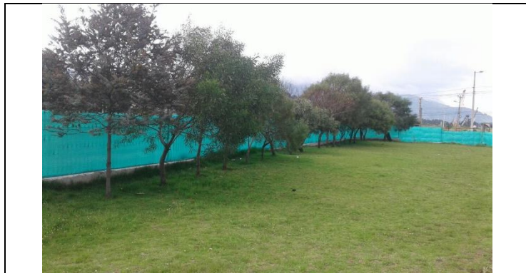
Avance del Túnel de Acceso a Cocheras