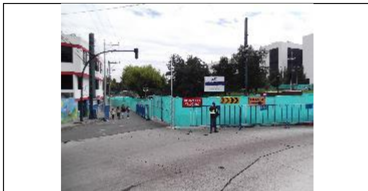
Tratamiento Terreno Av. Circunvalación y Pinllopacta (Río Machángara)