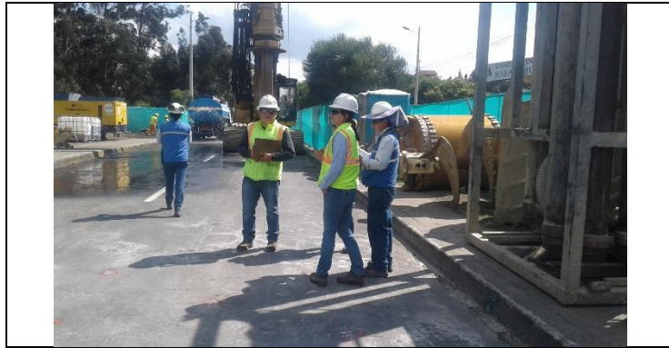
Salida de Emergencia 2