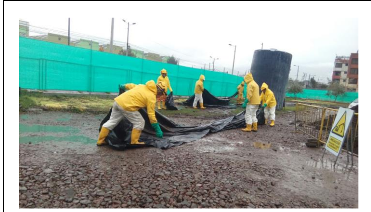
Pozo de Ventilación 5