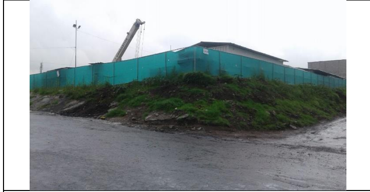
Campamento Morán Valverde