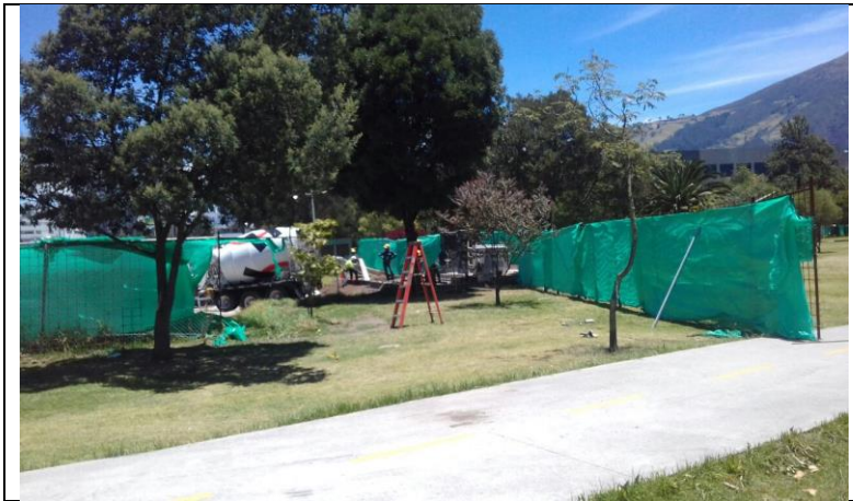
Estación Carolina-Ampliación TBM