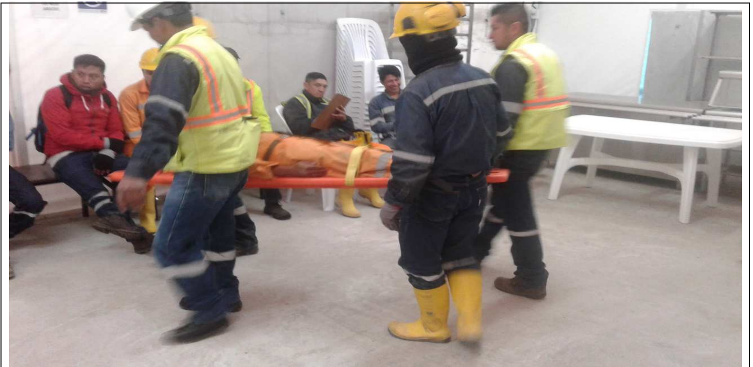
Frente de Obra: El Recreo