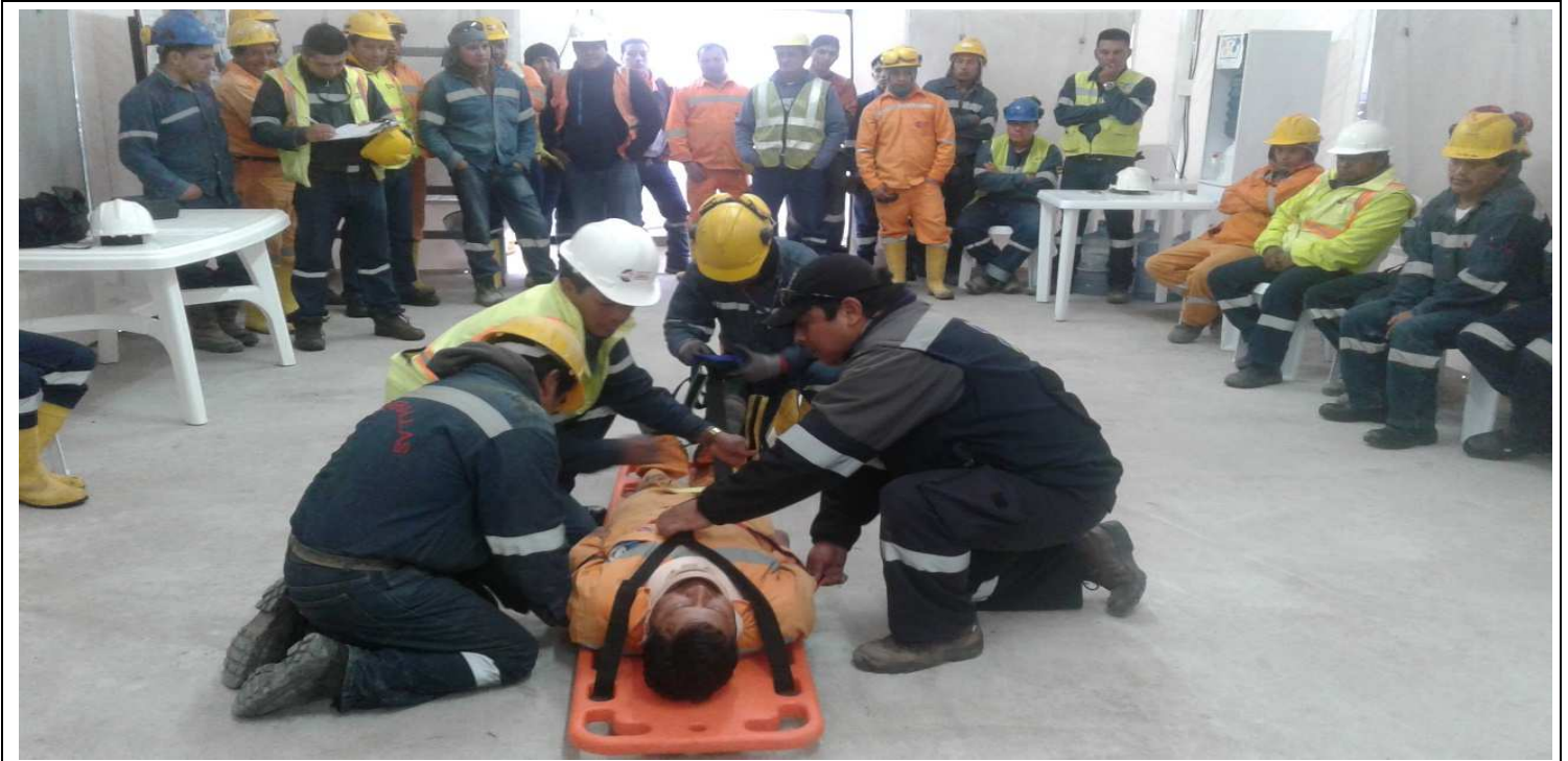
Frente de Obra: El Recreo