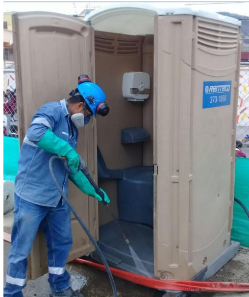
Fotografía N°1 Limpieza interior