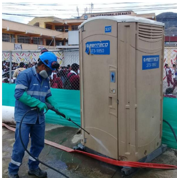
Fotografía N°2 Limpieza exterior