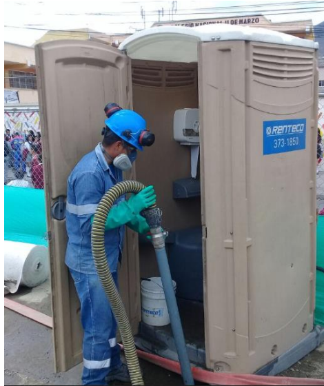
Foto N°3 Sución