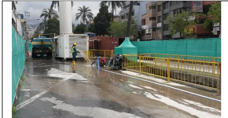
Tratamiento de Terreno Rodrigo de Chávez