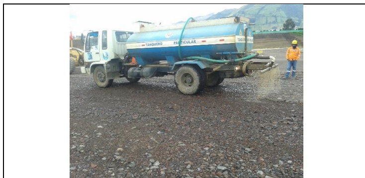
Patio de Talleres y Cocheras