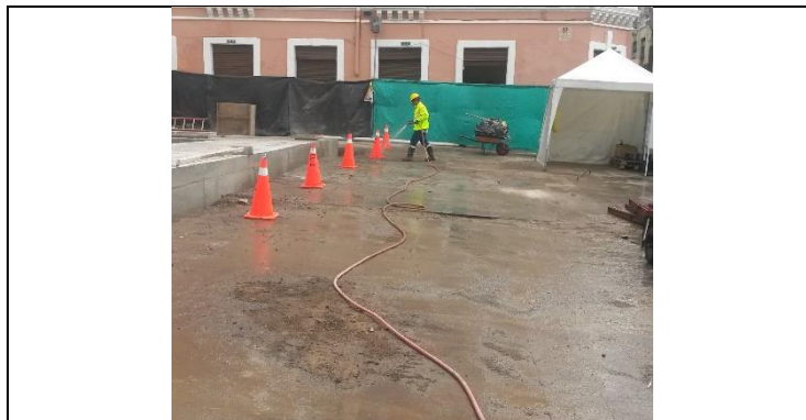
24 de Mayo