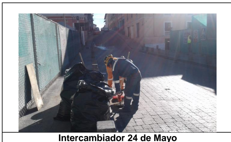
Intercambiador 24 de Mayo