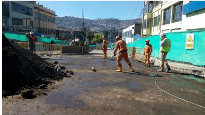
Tratamiento de Terreno en Rodrigo de Chávez