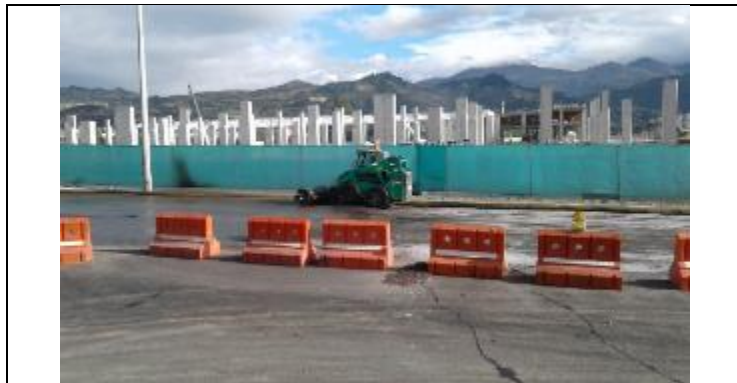
Patio de Talleres y Cocheras