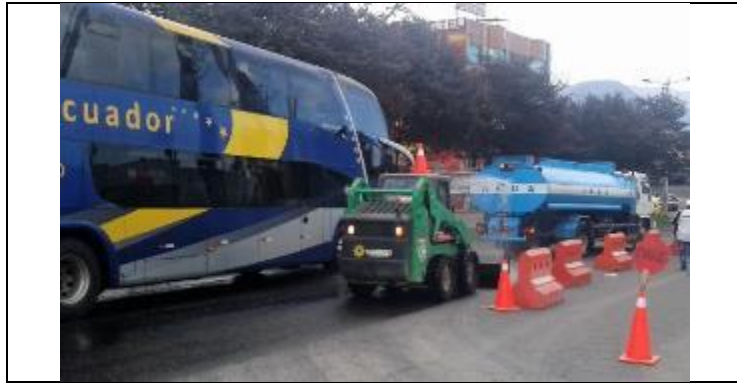
Planta de Dovelas Sur