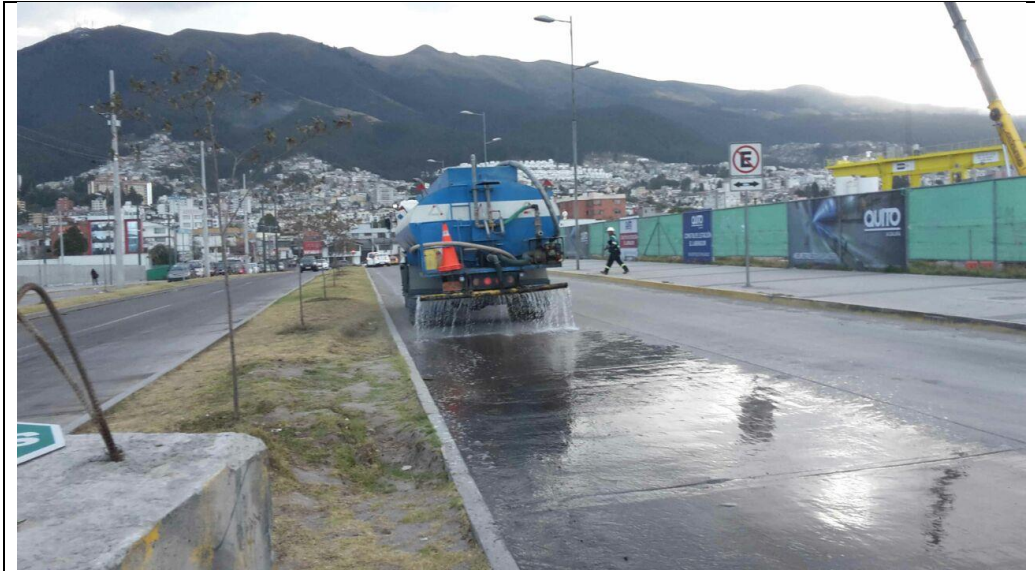
Fondo de Saco