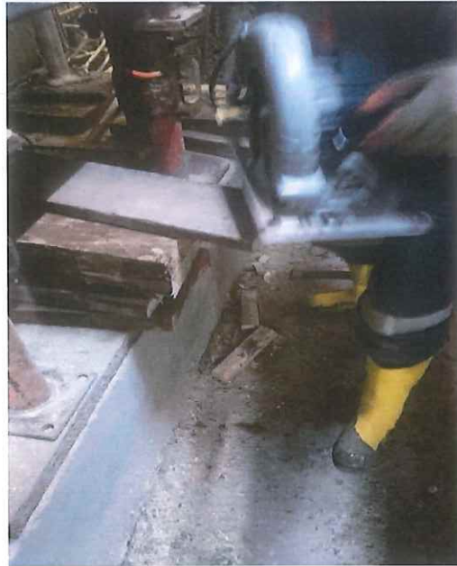
Pie: herida en pie izquierdo (salida)