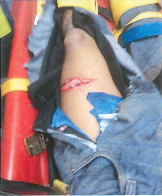
Pie: herida en pie izquierdo (entrada)