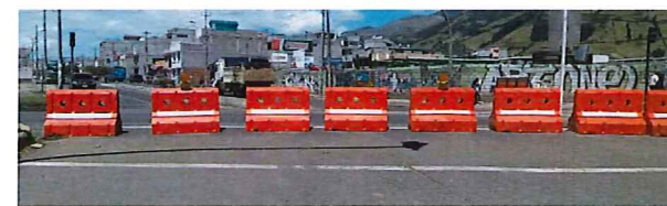
DETALLE 1 PROTECCIÓN CON NEW JERSEY