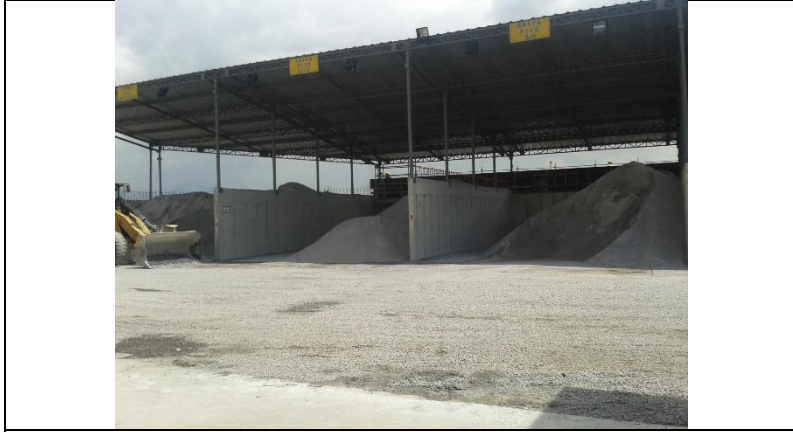
Planta de Dovelas Sur