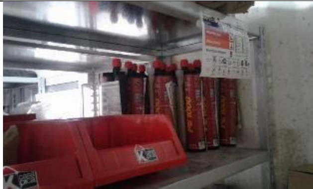
Gestión de productos químicos