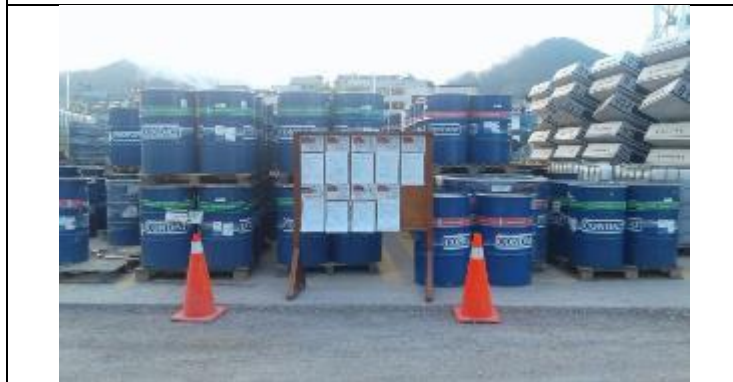
Gestión de productos químicos