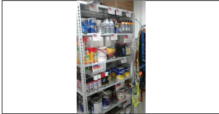
Gestión de productos químicos