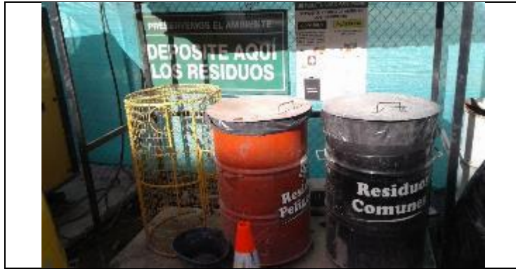
Caseta de desechos