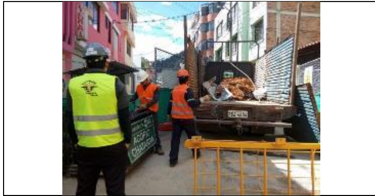
Entrega de restos metálicos