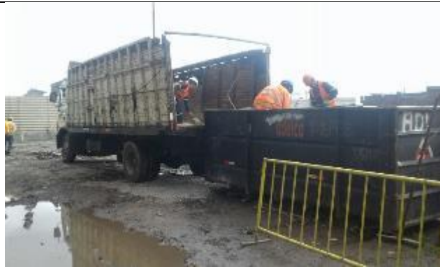
Entrega de residuos reciclables a gestor con licencia ambiental