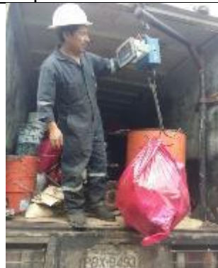
Entrega de residuos peligrosos al gestor con licencia ambiental