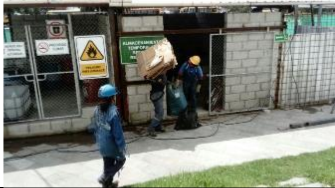
Entrega de residuos reciclables