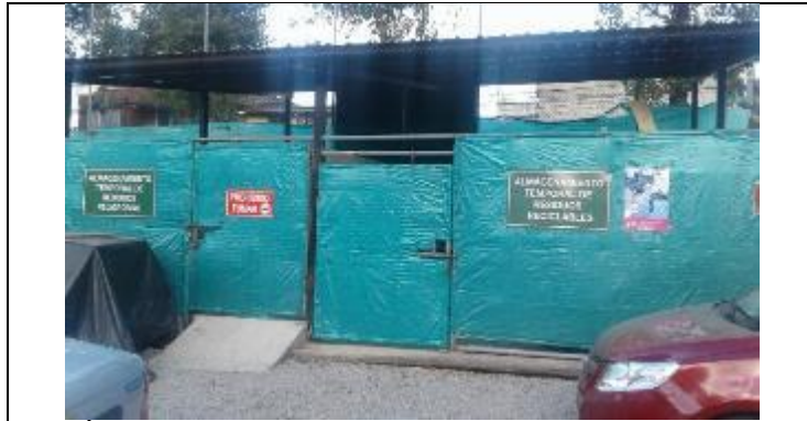
Área de almacenamiento temporal de residuos reciclables y peligrosos