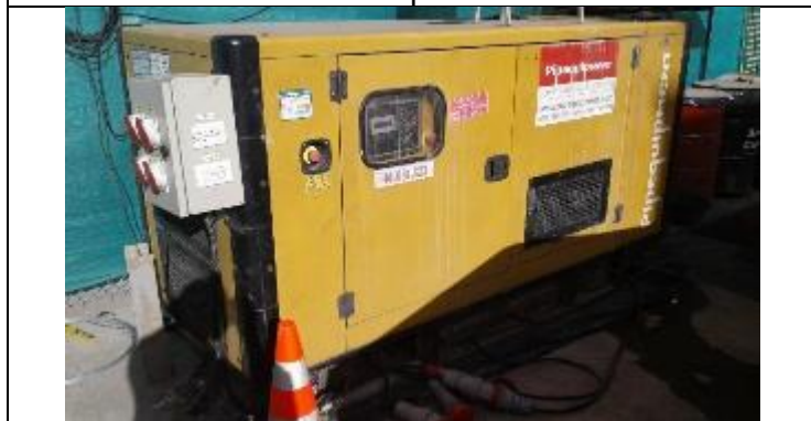
Generador con cubeto