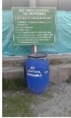
Kit Control de Derrames