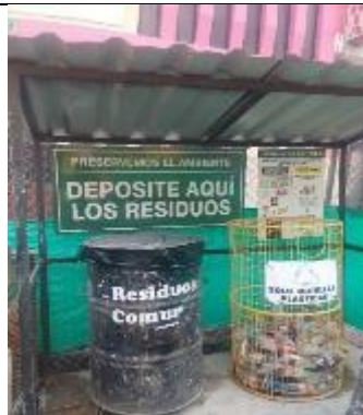
Caseta de residuos no peligrosos