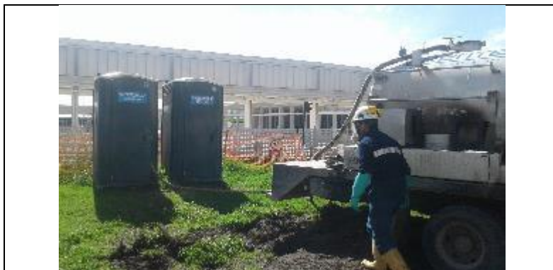
Limpieza de baños químicos