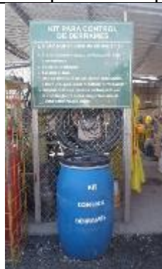
Kits para el control de derrames