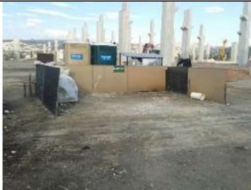
Área de almacenamiento temporal de residuos reciclables