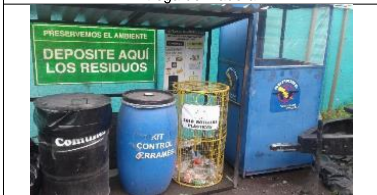
Caseta de recolección de residuos