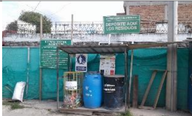
Caseta de residuos y kit de derrames