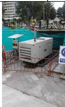
Generador con cubeto