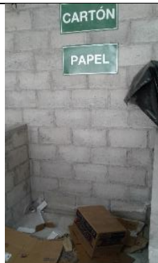
Entrega de residuos reciclables