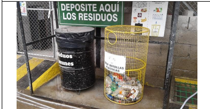
Caseta de acopio temporal de residuos no peligrosos