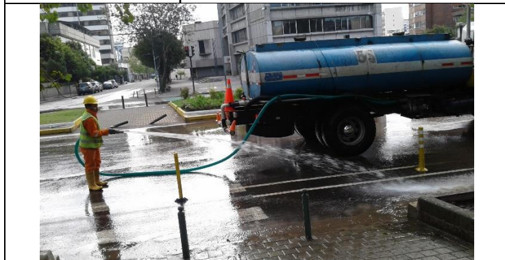
Limpieza de Av. Patria