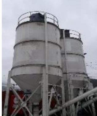
Implementación de sistema de captura de material particulado en silos