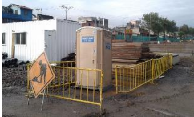
Limpieza de baños químicos por gestor con licencia ambiental