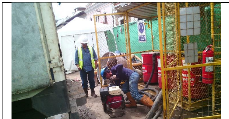
Entrega de residuos peligrosos al gestor con licencia ambiental