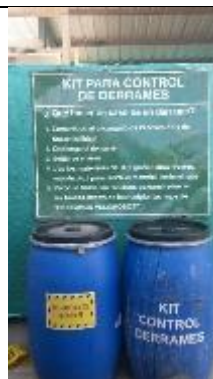
Kit de derrames