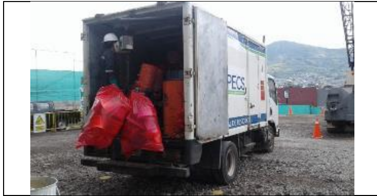
Entrega de residuos peligrosos al gestor con licencia ambiental