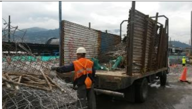
Entrega de residuos reciclables al gestor autorizado