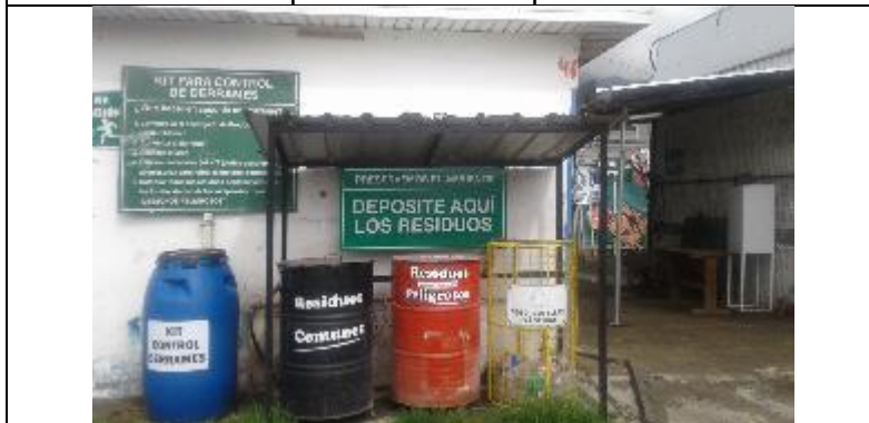
Kit de control de derrames