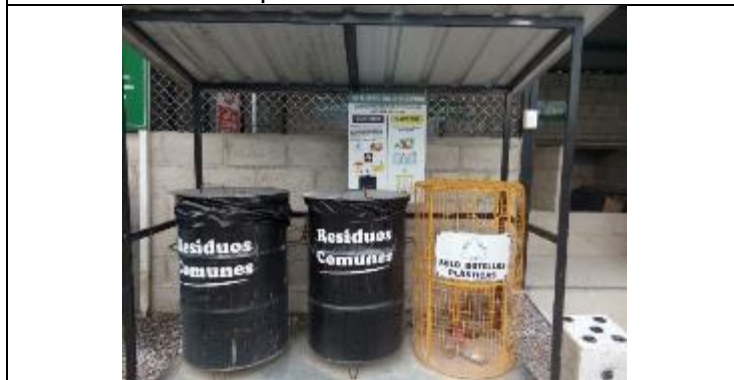
Caseta de residuos no peligrosos