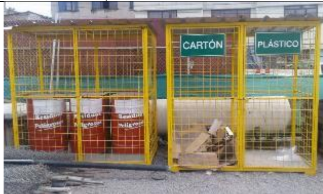
Áreas de almacenamiento temporal de residuos peligrosos y reciclables