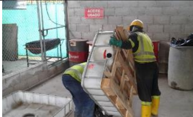
Entrega de desechos peligrosos