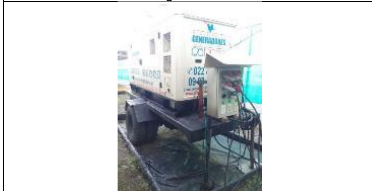
Generador con su respectivo cubeto