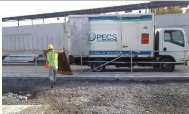
Entrega de residuos peligrosos a gestor con licencia ambiental