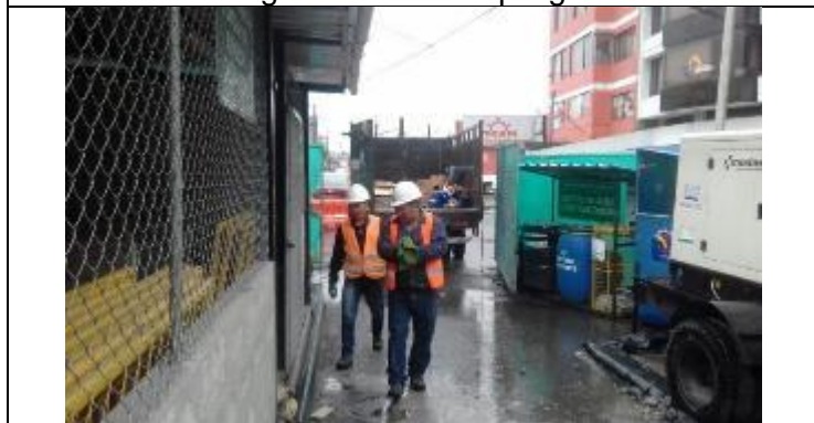
Entrega de madera