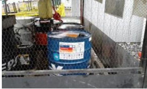
Gestión de productos químicos