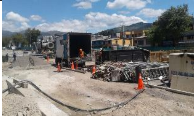
Entrega de residuos reciclables a gestor con licencia ambiental