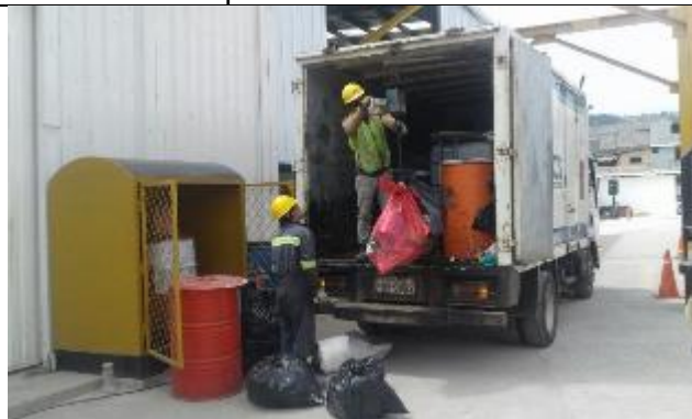
Gestión de residuos peligrosos por Gestor con licencia ambiental