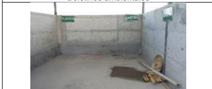
Área de almacenamiento temporal de residuos