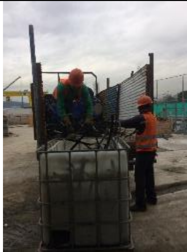
Entrega de chatarra