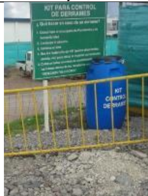
Kits de control de derrames