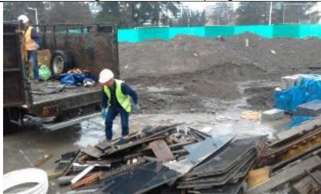
Entrega de madera