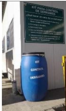
Kit de control de derrames