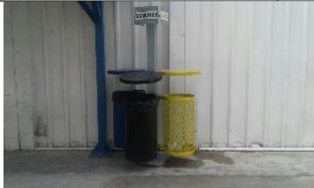
Separación de residuos