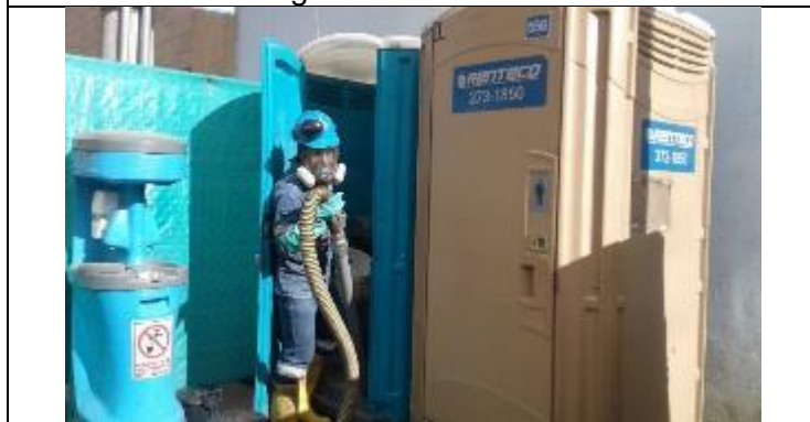
Limpieza de baños químicos