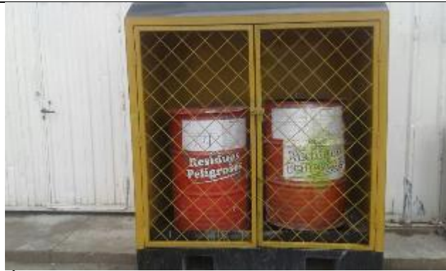
Área de almacenamiento de residuos peligrosos