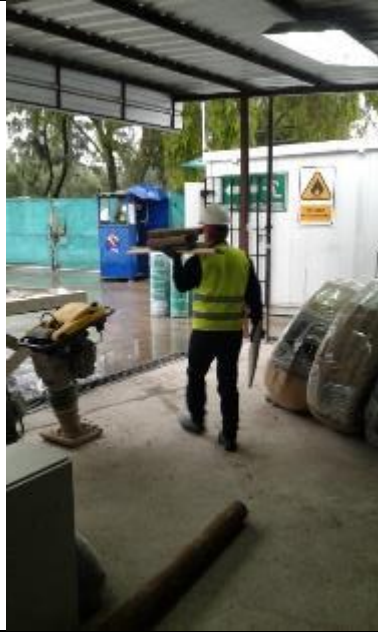
Entrega de residuos reciclables