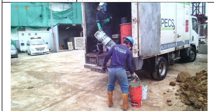
Entrega de residuos peligrosos a gestor con licencia ambiental