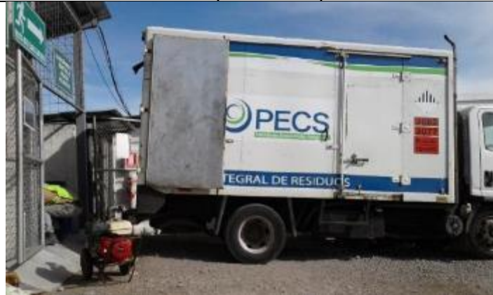
Entrega de residuos peligrosos a gestor con licencia ambiental