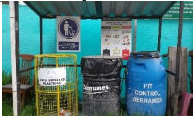
Caseta de recolección de residuos