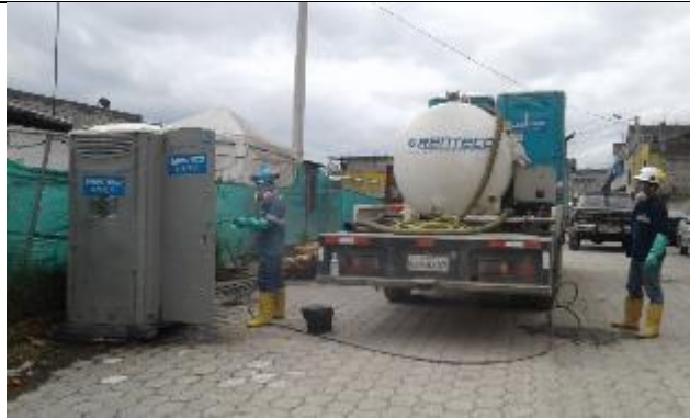
Limpieza de baños químicos por gestor con licencia ambiental