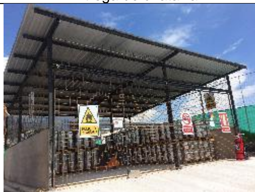
Almacenamiento de productos químicos