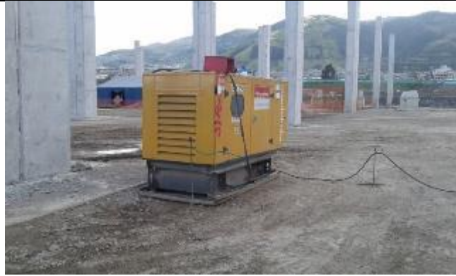
Generador con cubeto y cabina de insonorización