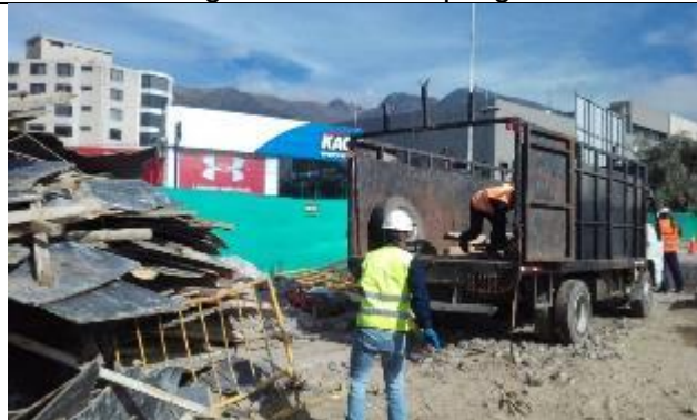
Entrega de madera