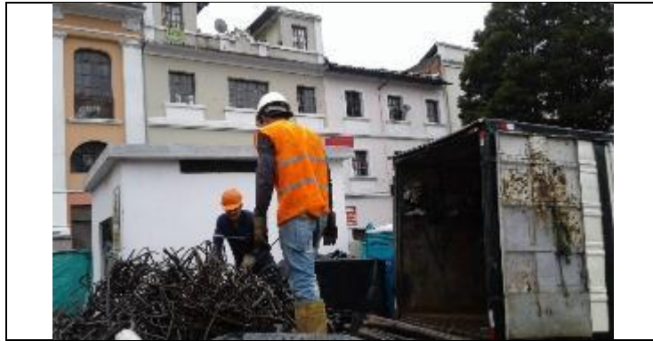
Entrega de restos metálicos