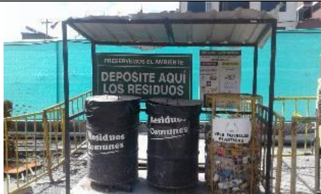
Separación de residuos