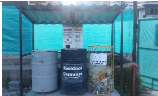
Gestión de residuos comunes y reciclables