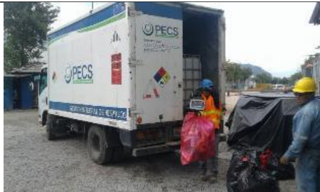
Entrega de residuos peligrosos a gestor con licencia ambiental