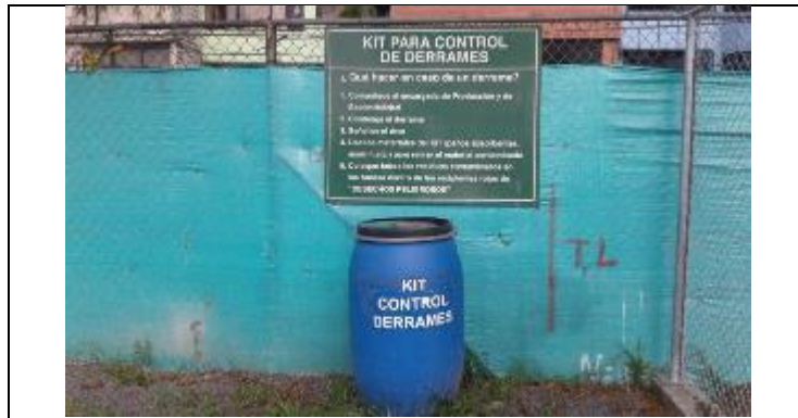
Kits de control de derrame