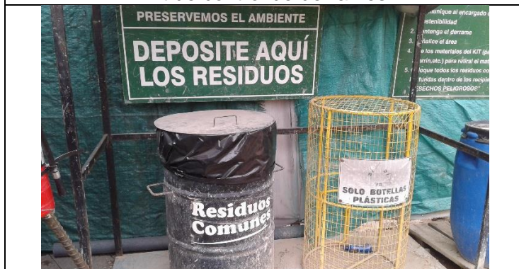
Caseta de almacenamiento de residuos no peligrosos