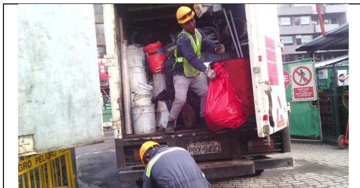
Entrega de residuos peligrosos a gestor con licencia ambiental