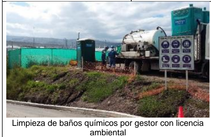
Limpieza de baños químicos por gestor con licencia ambiental