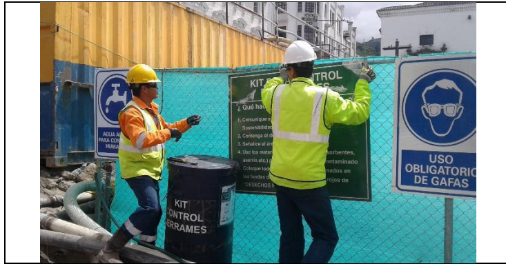
Kit de control de derrames