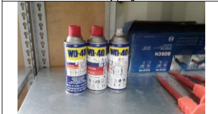
Gestión de productos químicos