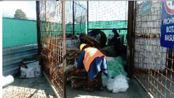
Entrega de desechos reciclables