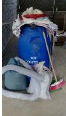
Kit de control de derrames