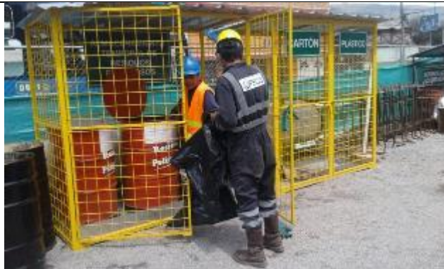
Gestión de residuos peligrosos por gestor con licencia ambiental