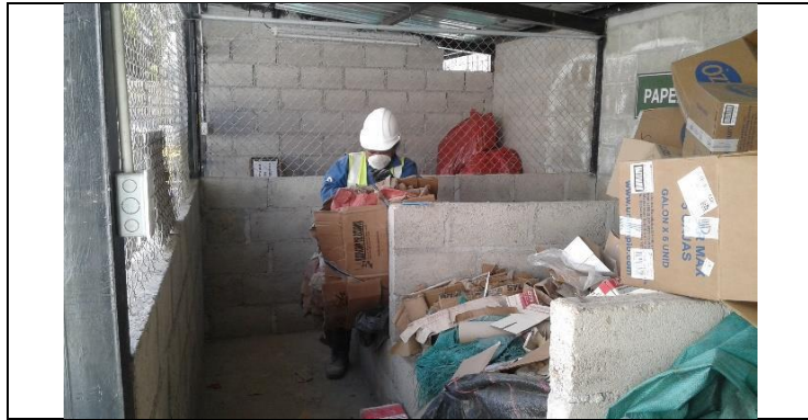
Entrega de residuos reciclables