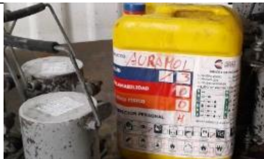
Gestión de Productos Químicos