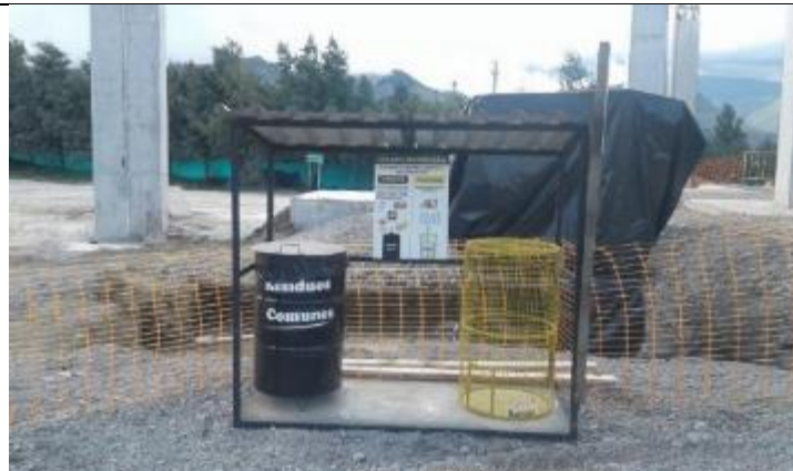
Gestión y separación de residuos