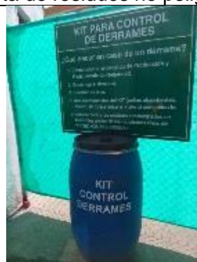
Kit de control de derrames