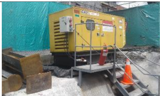
Generadores con cubeto y cabina de insonorización