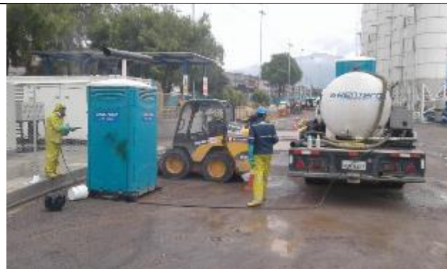
Limpieza de baños químicos por gestor con licencia ambiental