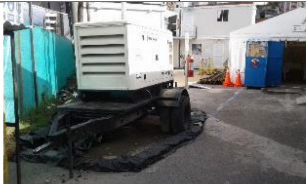
Generador con cubeto