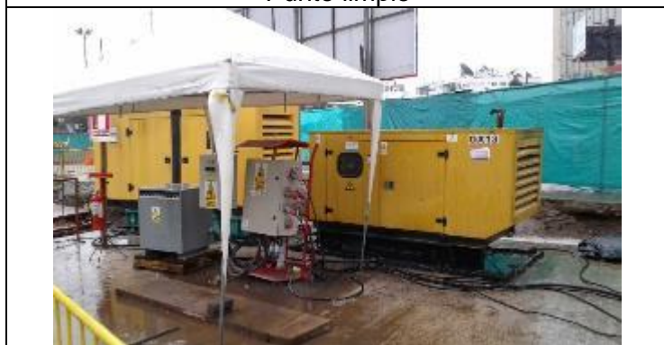
Generador con cubeto