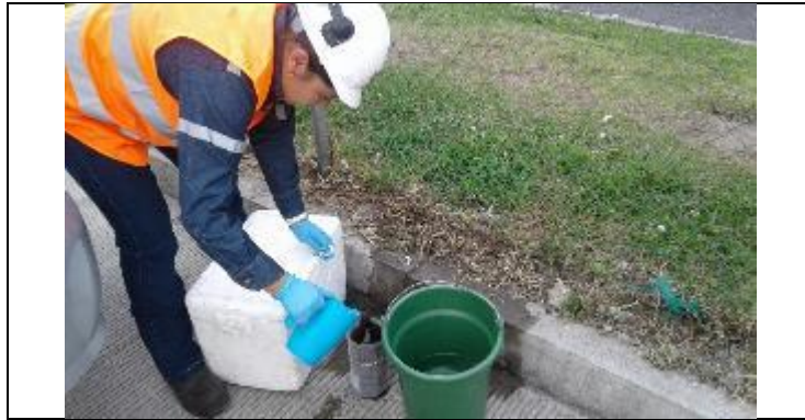
Muestreo aguas de infiltración