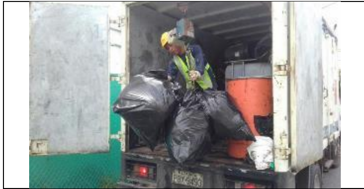
Entrega de desechos peligrosos