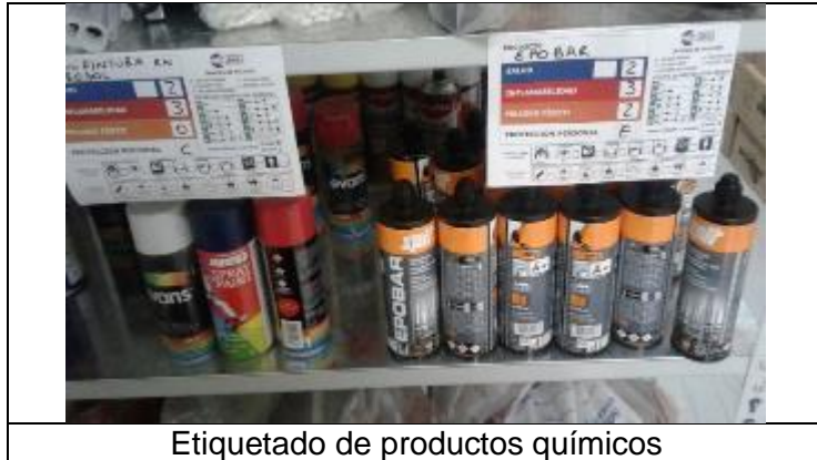
Etiquetado de productos químicos