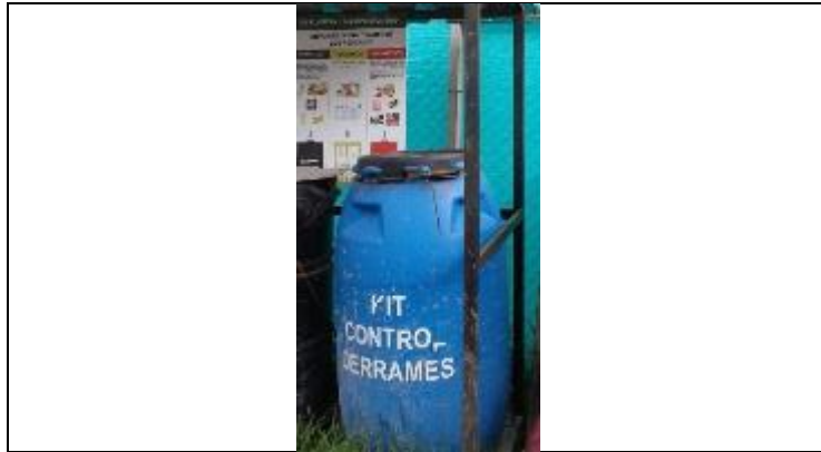
Kit de control de derrames