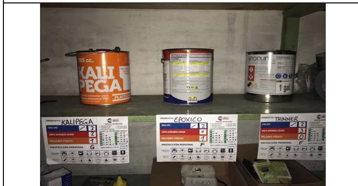
Etiquetado de productos químicos