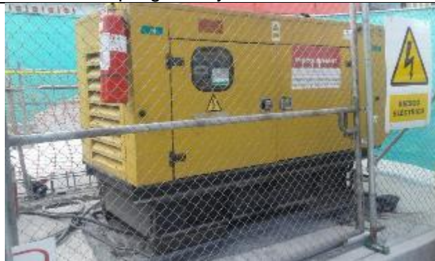
Generador con cubeto y cabina de insonorización