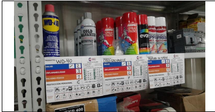
Etiquetado de productos químicos