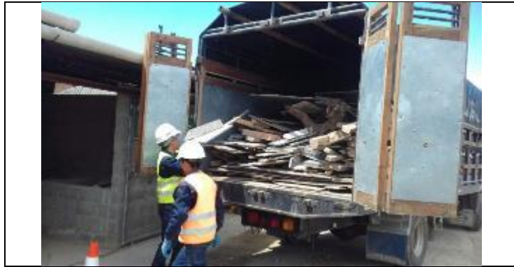
Entrega de madera