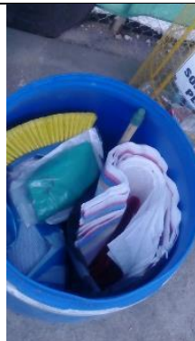
Kit de control de derrames