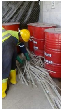
Entrega de desechos peligrosos