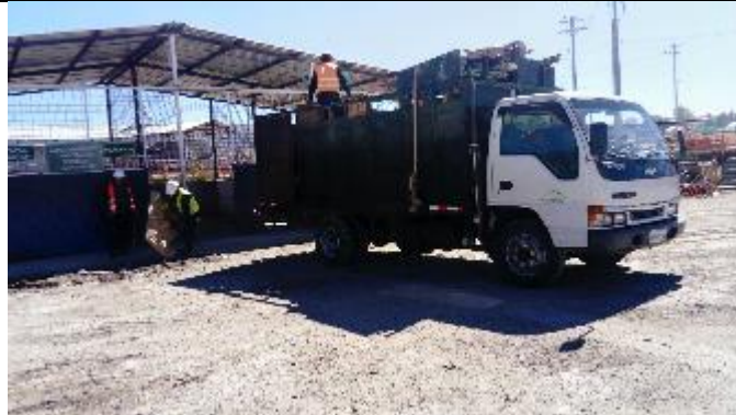
Entrega de residuos de madera