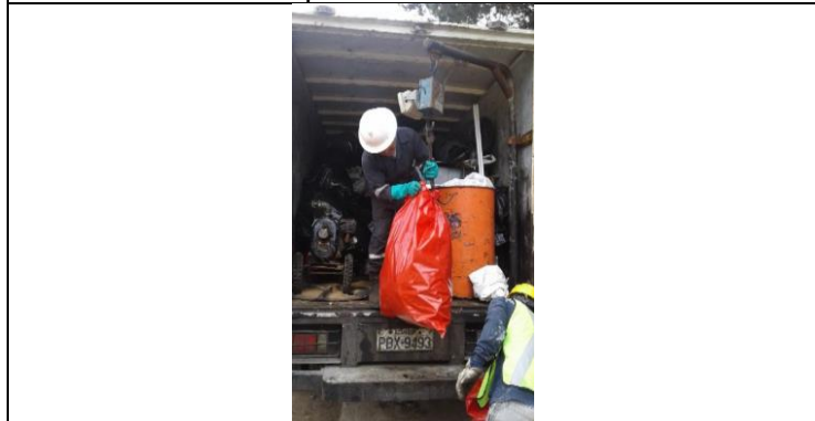
Entrega de residuos peligrosos a gestor con licencia ambiental