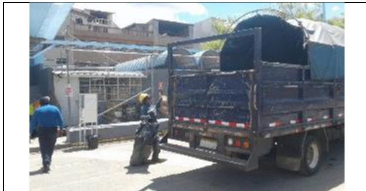
Entrega de residuos reciclables a gestor con licencia ambiental