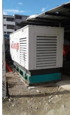
Generador con cubeto