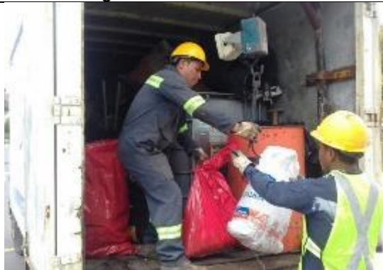
Entrega de desechos peligrosos