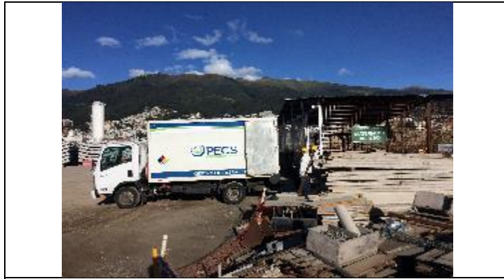
Entrega de desechos peligrosos a gestor