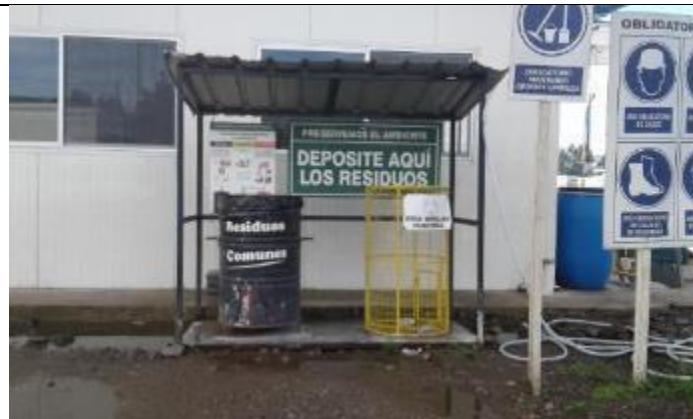
Clasificación de residuos