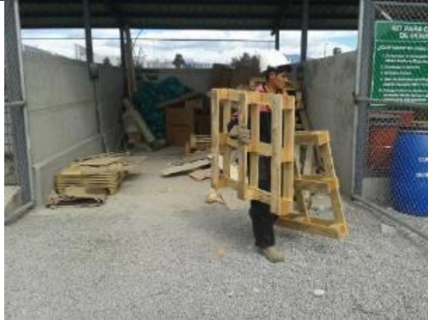
Entrega de residuos reciclables a gestor con licencia ambiental