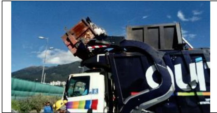
Entrega de desechos comunes