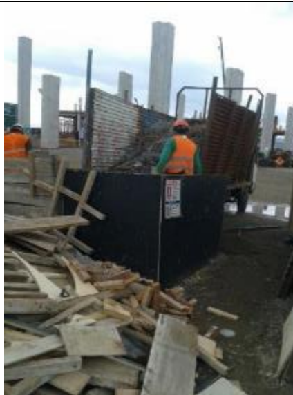
Entrega de residuos reciclables a gestor con licencia ambiental