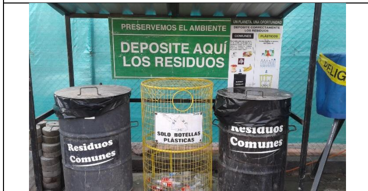
Caseta de almacenamiento temporal de residuos no peligrosos