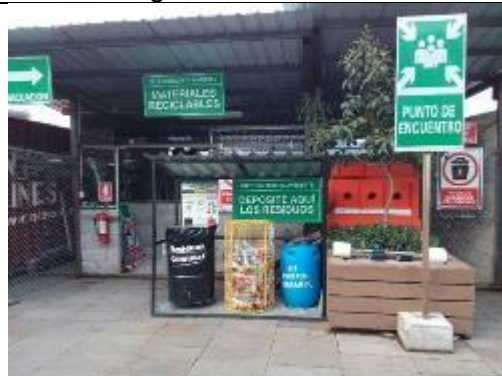
Área de almacenamiento temporal de residuos