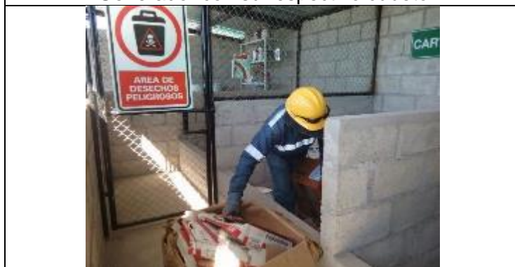
Entrega de residuos reciclables