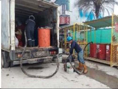
Entrega de residuos peligrosos al gestor con licencia ambiental