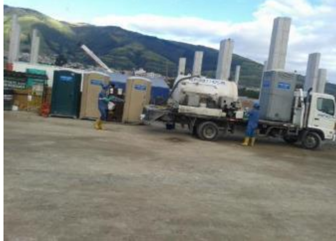
Limpieza de baños químicos por gestor con licencia ambiental