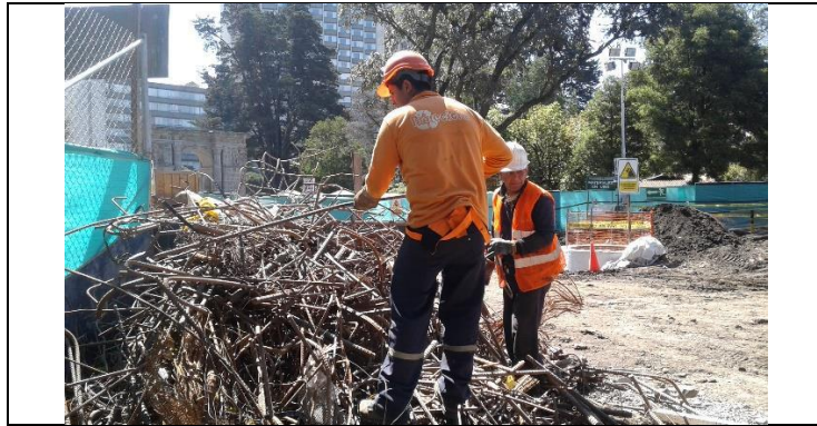
Entrega de restos metálicos