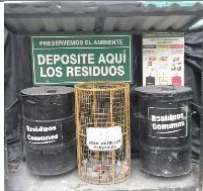
Caseta de residuos no peligrosos