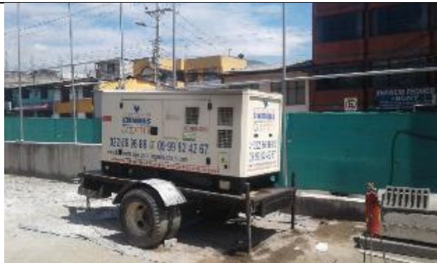
Generador con cubeto y cabina de insonorización