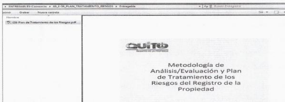
Imagen 2: E59 Plan de tratamiento de los Riesgos

Además existe por sub carpeta de nombre Entregable con dos archivos el primero de nombre ANEXO a E59 Plan de Tratamiento de los Riesgos (Imagen 2)