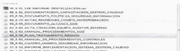
Imagen 1: E.59