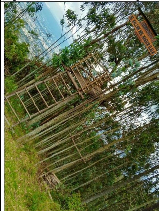
Figura 8. Presunta construcción ilegal