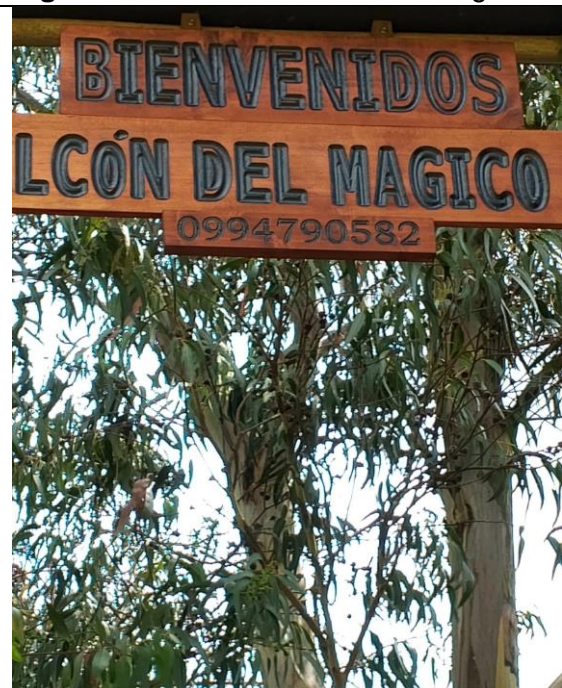
Figura 5. Presunta construcción ilegal