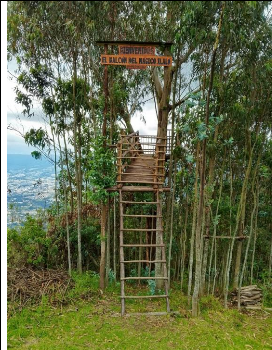
Figura 6. Presunta construcción ilegal