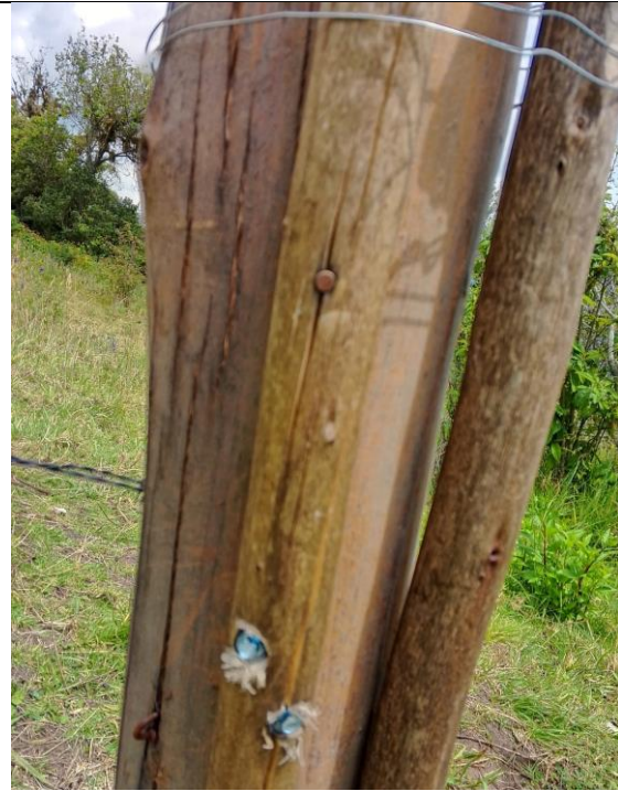
Figura 7. Presunta construcción ilegal