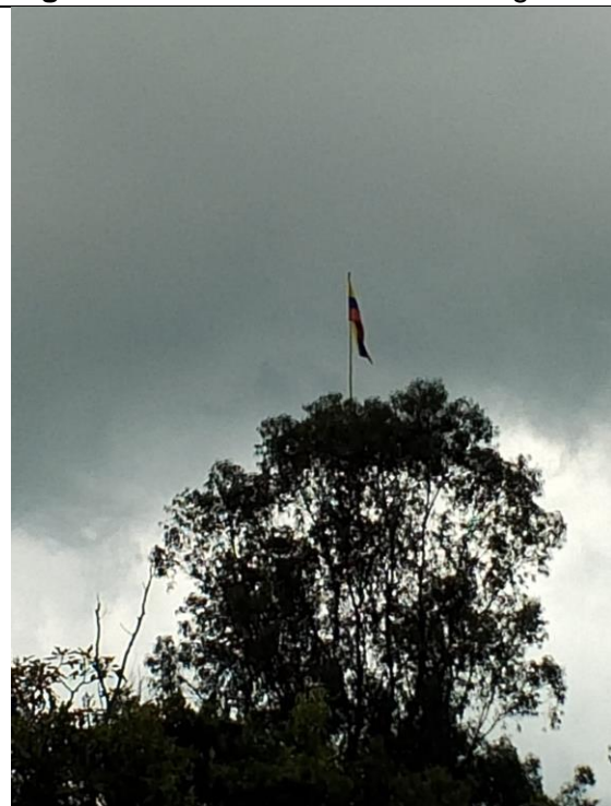
Figura 9. Punto de referencia "Bandera"