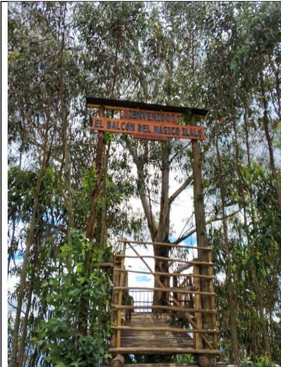
Figura 2. Presunta construcción ilegal