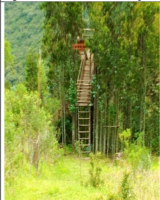
Figura 4. Presunta construcción ilegal