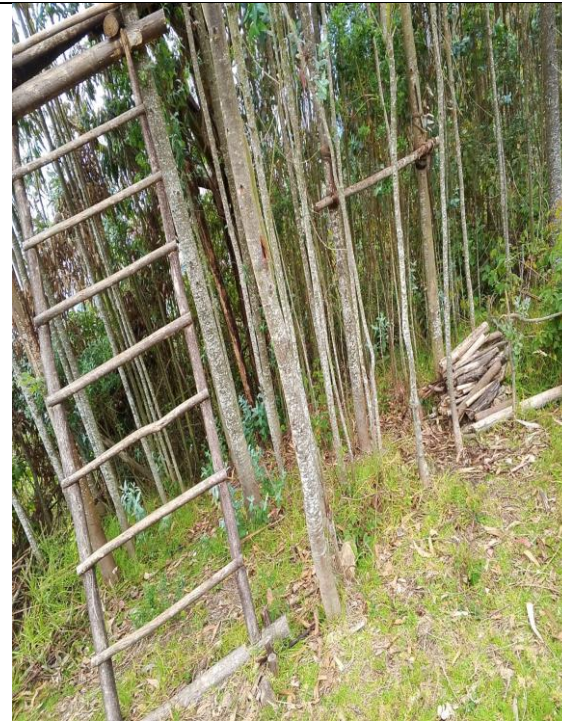
Figura 3. Presunta construcción ilegal