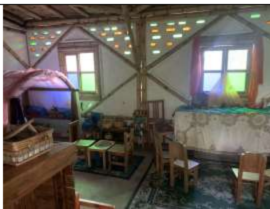
Foto 2. Área de Taller