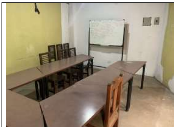
Foto 1. Área de Taller