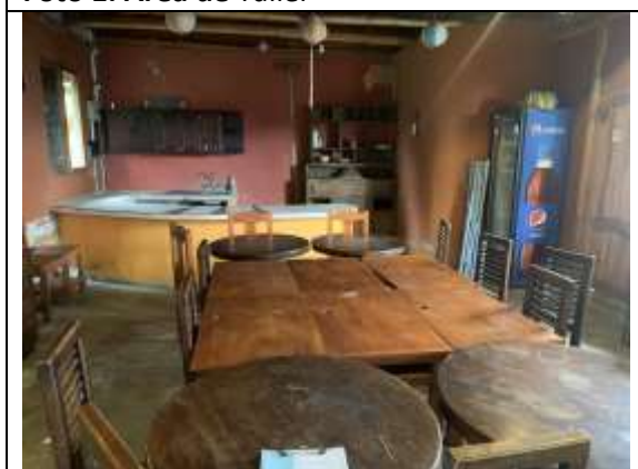
Foto 3. Cafetería