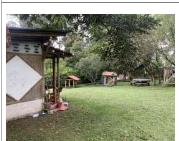
Foto 5. Área de sembrío