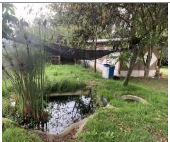
Foto 6. Área de compostaje