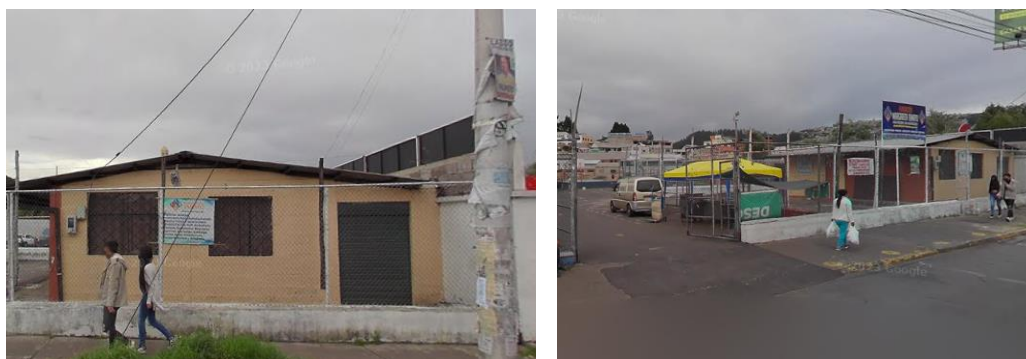
Fotografía del predio