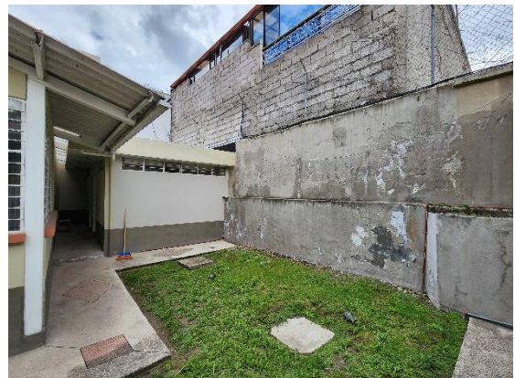
Fotografía 12: Vista lindero sur

Lindero oeste con predio municipal No.803892