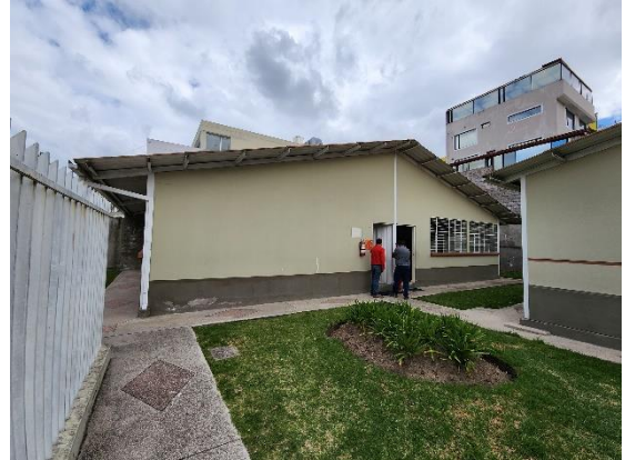
Fotografía 2: Vista bloque 1 área de psicomotricidad