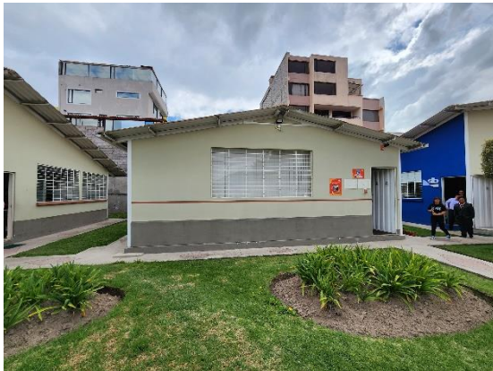
Fotografía 3: vista bloque 2 área administrativa