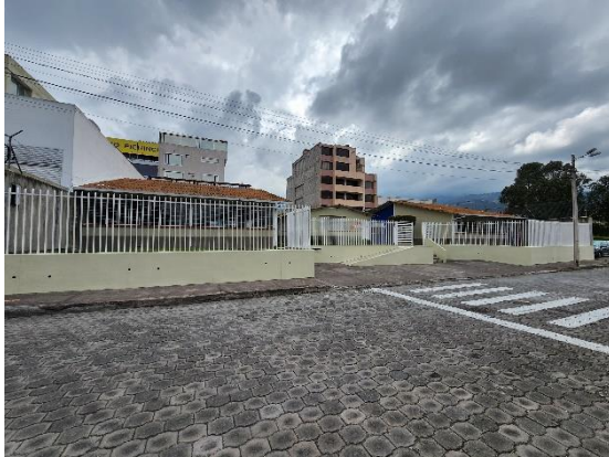
Fotografía 1: Vista externa ingreso principal