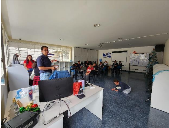
Fotografía 7: Vista interna aula pre laboral