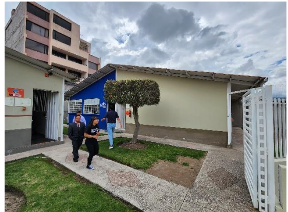
Fotografía 4: vista bloque 3 área pre laboral