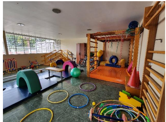
Fotografía 10: Vista interna taller lúdico, psicomotriz