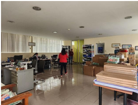
Fotografía 9: Vista interna área administrativa