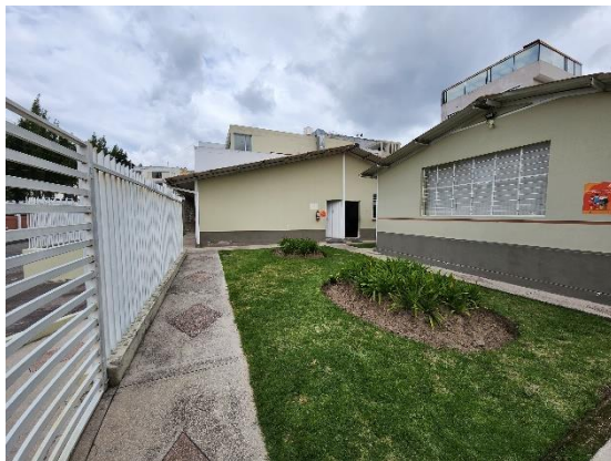
Fotografía 5: Vista jardín frontal