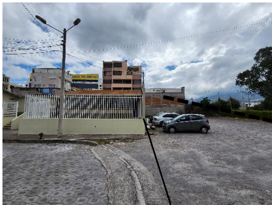
Fotografía 11: Vista exterior lindero oeste

Lindero oeste con predio municipal No.803892