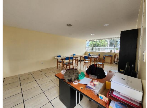
Fotografía 8: Vista interna taller pre laboral