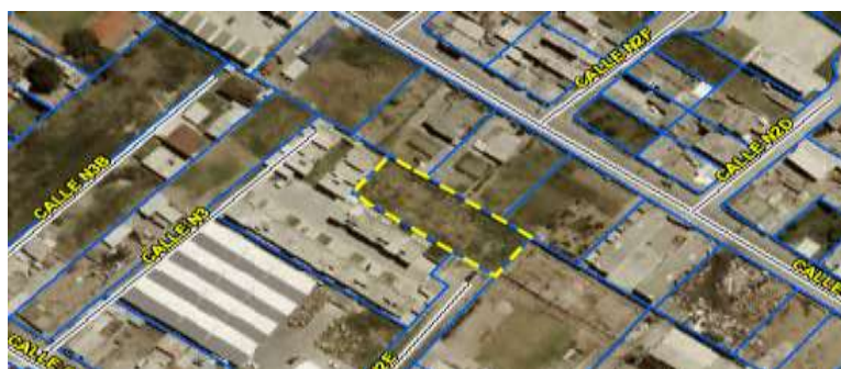
Grafico No. 1

Parroquia: CALDERÓN Barrio/Sector: PAREDES Dependencia administrativa: Administración Zonal Calderón Uso de suelo: (R) Residencial