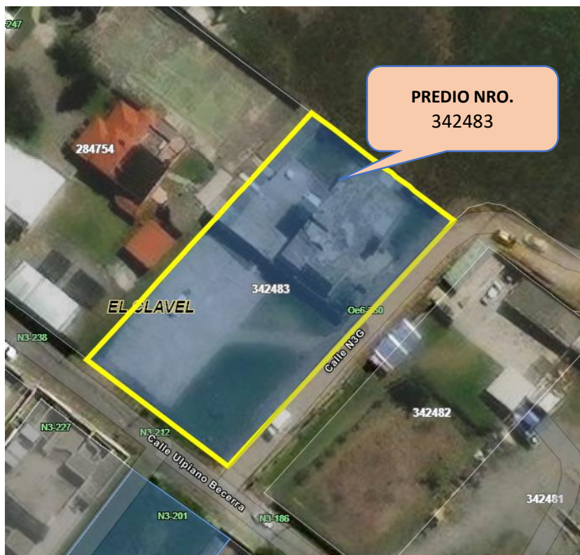
Imagen 1: Imagen del Predio 342483.

El predio No. 342483 con clave catastral 13215 05 013 se encuentra ubicado en el sector de El Clavel, Parroquia Calderón, Zona Metropolitana de Calderón.