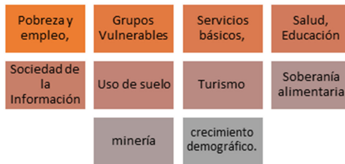
Figura 4. Alineación objetivo de desarrollo 1 con prioridades territoriales de la Agenda de Coordinación Zonal N°9

En consecuencia, las prioridades que se establecen en este Plan de Desarrollo y Ordenamiento Territorial –PMDOT, en el marco de las competencias concurrentes del GAD DMQ, avizora una gestión pública que garantice el ejercicio pleno de los derechos a la educación y salud de calidad de su población; garantice los derechos sexuales y reproductivos; cuide de los más vulnerables y dote de servicios básicos mediante el gobierno del territorio y la gestión del uso del suelo; genere las condiciones para el fortalecimiento de las cadenas productivas y de valor que garanticen la soberanía alimentaria y la vocación territorial y de su gente; promueva, además, los derechos digitales creando las condiciones para la transición hacia una sociedad de la información.