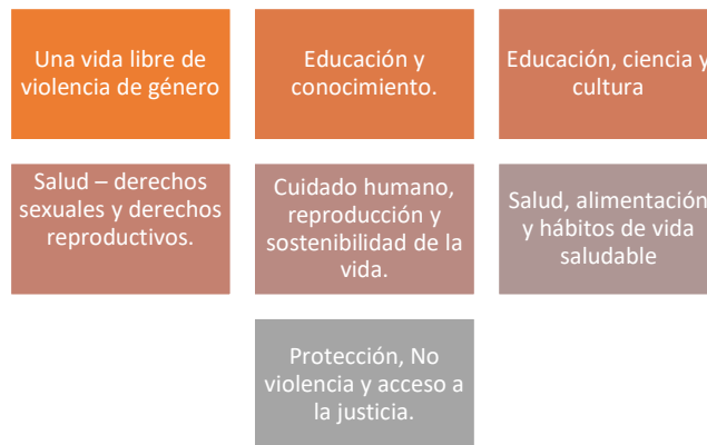
Figura 1. Alineación de objetivo de desarrollo 1 con ámbitos de la Agenda Nacional de Igualdad de Género e igualdad Intergeneracional

En consonancia con lo expuesto, las prioridades que se establecen en este Plan de Desarrollo y Ordenamiento Territorial, el marco de la concurrencia de las competencias del GAD DMQ, avizora una población en aprendizaje constante, creadora de ciencia y conocimiento, que fortalezca su memoria e identidad cultural; aquella que ejerza sus derechos sexuales y reproductivos, así como sus hábitos de vida saludables en entornos libres de violencia.