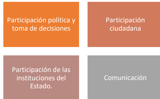
Figura 3. Alineación de objetivo de desarrollo 3 con ámbitos de la Agenda Nacional de Igualdad de Género e igualdad Intergeneracional

Objetivo de gestión 3.1 Brindar servicios de calidad y atender de manera eficiente las necesidades de la población.