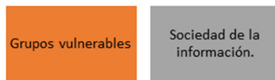
Figura 6. Alineación objetivo de desarrollo 3 con prioridades territoriales de la Agenda de Coordinación Zonal N°9

Una gobernanza inclusiva se sostiene en un régimen político y de gobierno que viabiliza una gestión transparente basado en el intercambio entre la ciudadanía, órganos de gobierno y sus funcionarios y los representantes electos por voto popular mediante estrategias de desarrollo tecnológico que fortalecen los mecanismos de participación y permitan la transición hacia la sociedad de la información. A través de la implementación de canales digitales modernos de atención al usuario, renovados sistemas de gestión municipal, así como, sistemas de transparencia en procesos y acceso a la información pública, se consolidan las bases de una democracia que promueva las libertades y la participación de todos los actores en el territorio.