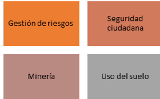
Figura 5. Alineación objetivo de desarrollo 2 con prioridades territoriales de la Agenda de Coordinación Zonal N°9