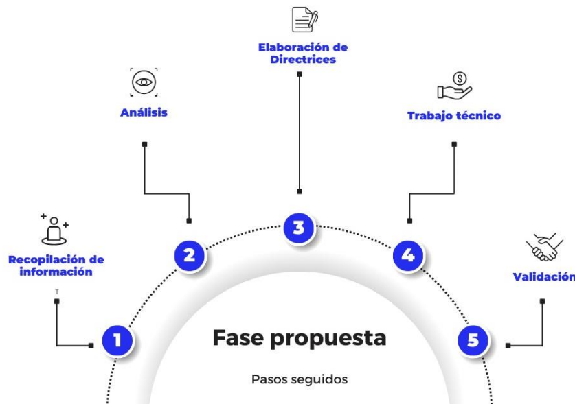
Figura 1. Fases de implementación para formulación/actualización de Metas – Indicadores; Programas – Proyectos; Presupuesto Referencial