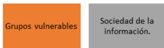
Tabla 2. Alineación PMDOT - Agenda de Coordinación Zonal 9