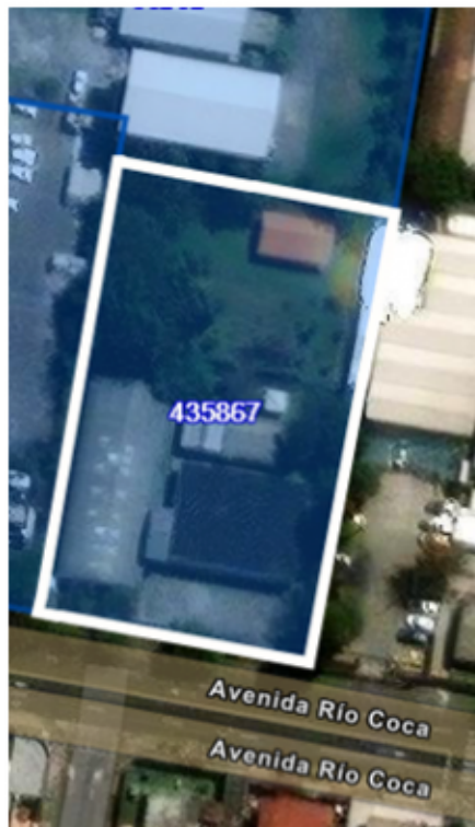
Tu catastro en línea

A continuación, se muestra la ubicación gráfica del inmueble en referencia y sus colindantes capturas de pantalla tomadas del sistema SIREC-Q y Tu Catastro en línea, con: