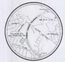
UBICACION ESC. 1:1000