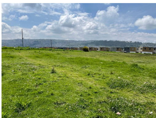
Imagen 2: Canchas deportivas