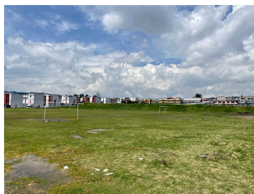
Imagen 3: Canchas deportivas sobre lote global