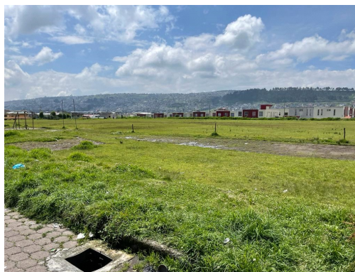
Imagen 5: Cancha sobre el lugar solicitado