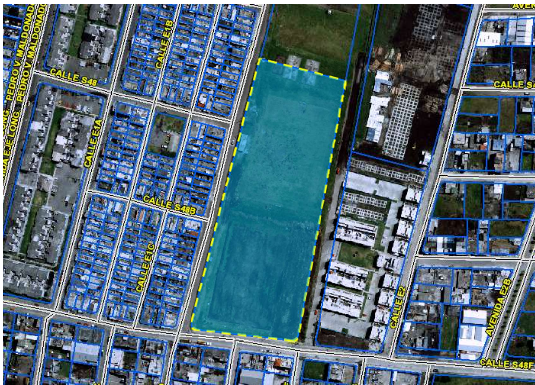
Imagen 1 : Ubicación del predio No. 3761480