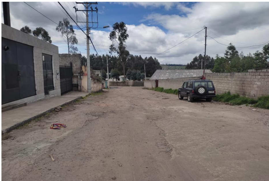
Fotografía 4: Calle S59D