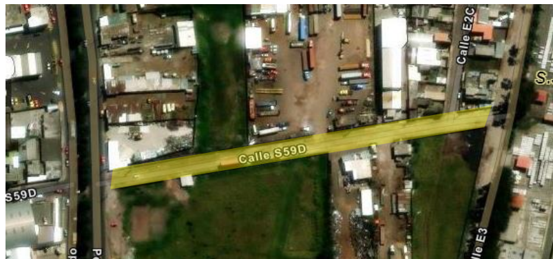
Hoja vial No.33407