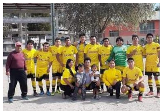
Imágenes de actividades deportivas de la Liga Deportiva Barrial La Josefina