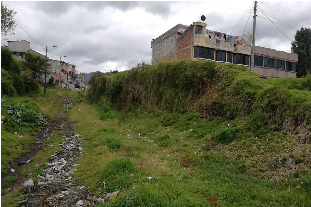
Fotografías: Calle Francisco Campos