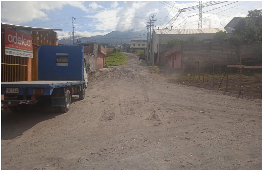
Fotografías: Calle Francisco Campos