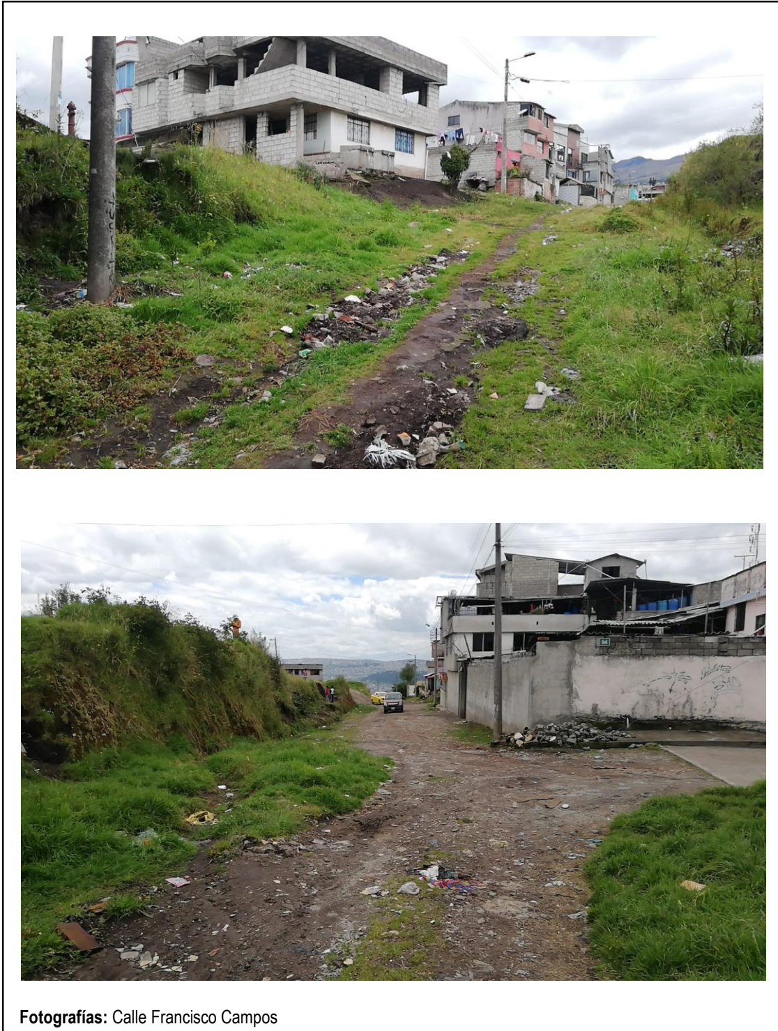
Fotografías: Calle Francisco Campos