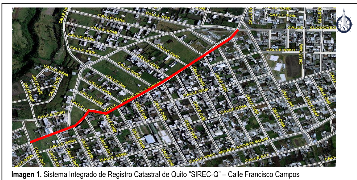
Imagen 1. Sistema Integrado de Registro Catastral de Quito "SIREC-Q" – Calle Francisco Campos

Sector o barrio: San Fernando de Guamaní