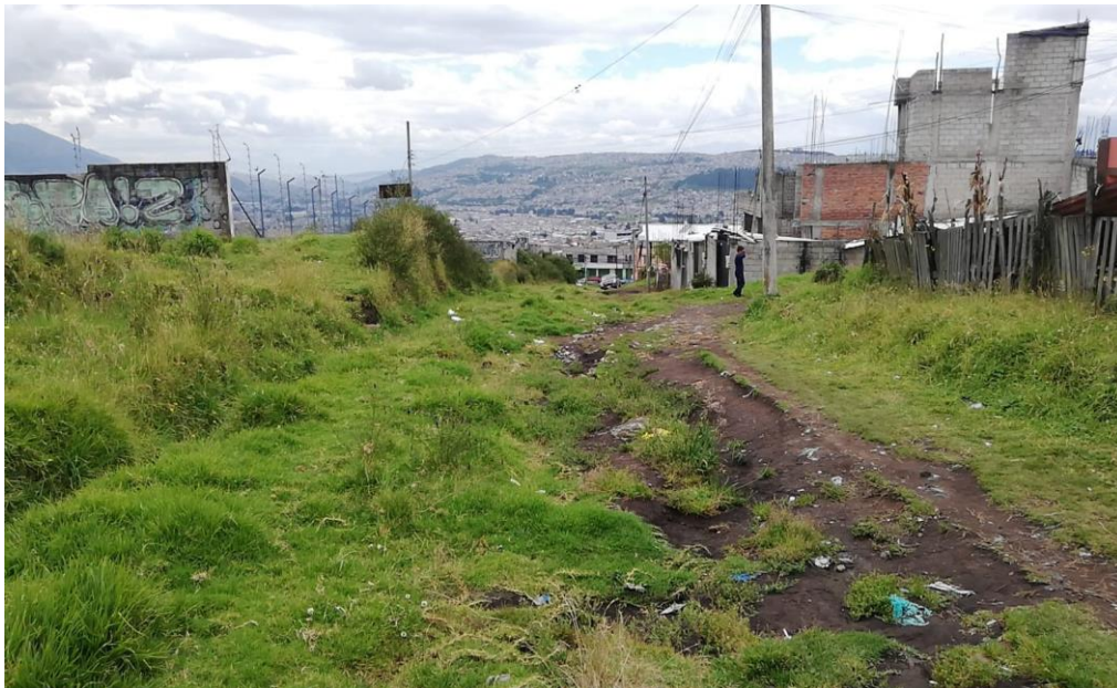
Fotografías: Calle Francisco Campos