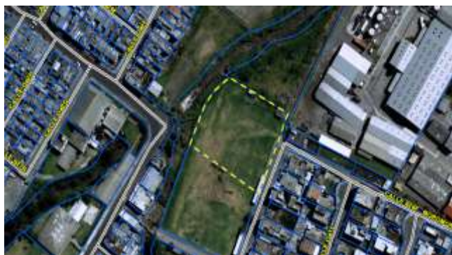
Grafico No. 1

Zona Metropolitana: ELOY ALFARO Parroquia: SOLANDA Barrio/Sector: UNION POPULAR Dependencia administrativa: ADMINISTRACIÓN ZONAL ELOY ALFARO Uso de suelo: (PE/CPN) Protección Ecológica/Conservación del Patrimonio Natural