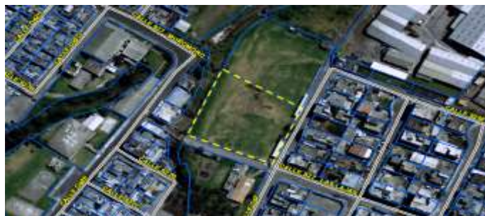
Gráfico No. 1 Fuente: SIREC-Q - MDMQ

Zona Metropolitana: ELOY ALFARO Parroquia: SOLANDA Barrio/Sector: UNION POPULAR Dependencia administrativa: ADMINISTRACIÓN ZONAL ELOY ALFARO Uso de suelo: (PE/CPN) Protección Ecológica/Conservación del Patrimonio Natural